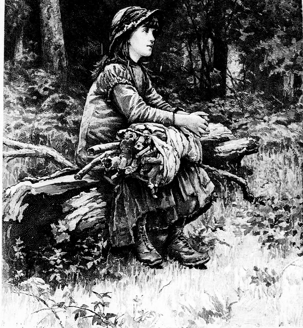
SZEGÉNY KIS LÁNY AZ ERDŐBEN. (Lásd a 267. lapon.)