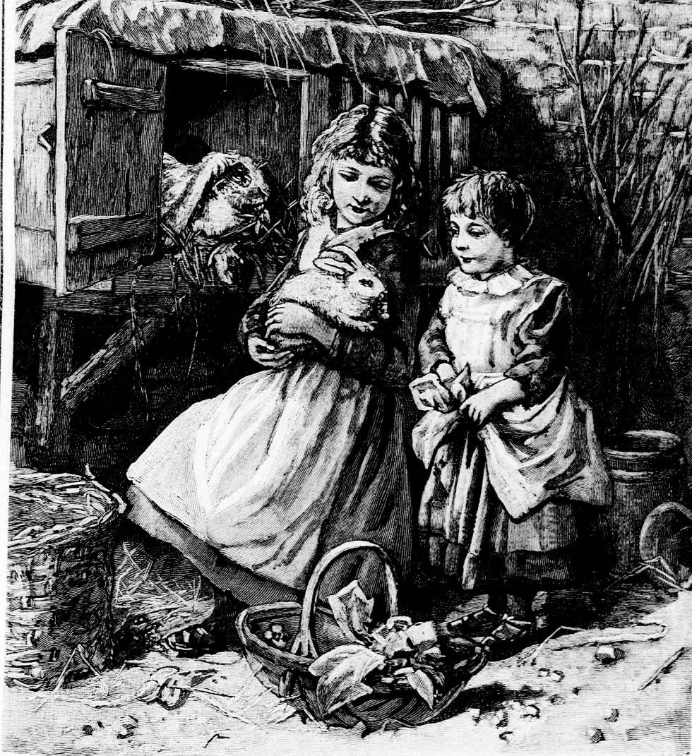
KIS NYÚL. (Lásd a 282. lapon.)