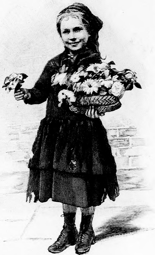
VEGYETEK VIRÁGOT! (Lásd a 383. lapon.)