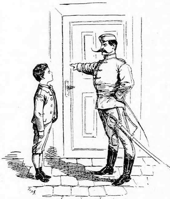
— REGRUTA FERKE, ÁLLJ ELŐ!