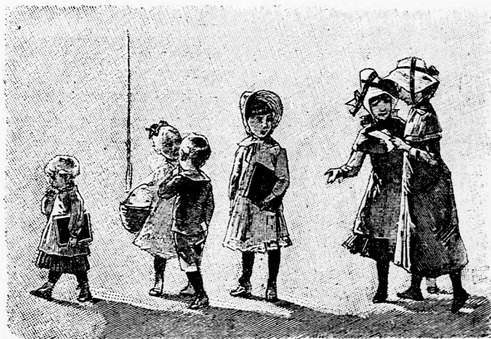
A FURFANGOS LEVÉL. (Lásd a 47. lapon.)

— Mi ez? kiáltá Kelemen ur haragosan. Miért hozott ide a vasuthoz?