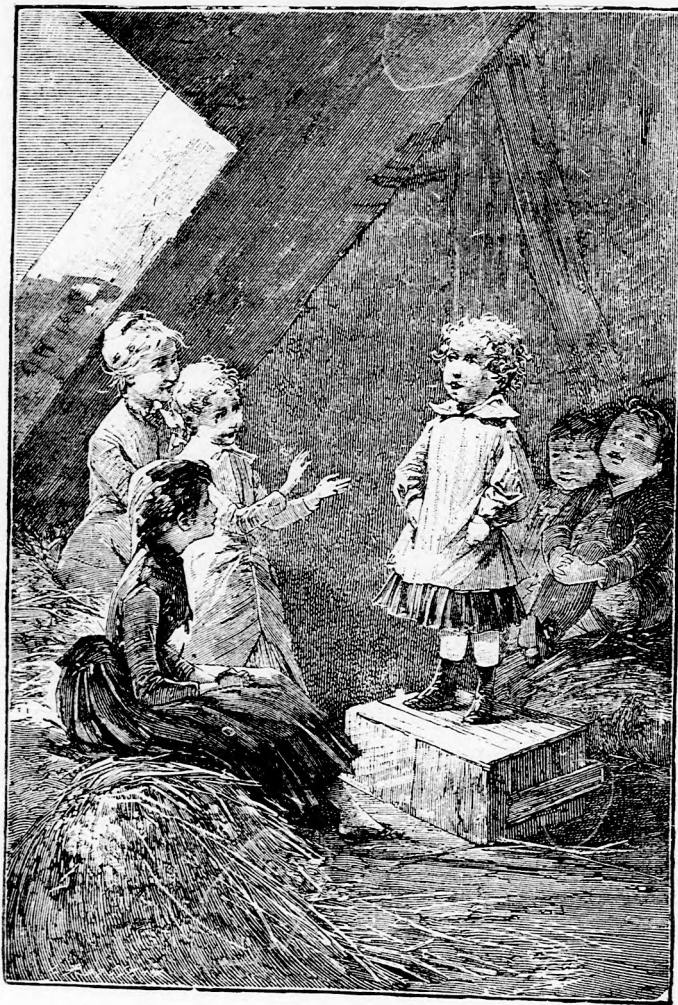
PARÁDÉ A PADLÁSON. (Lásd a 39. lapon.)

hogy azok a sovány lovak nagyon veszedelmesen iramodtak volna; csak éppen hogy lassacskán elkoczogtak, ezt is csak addig, amíg az országuton haladtak.