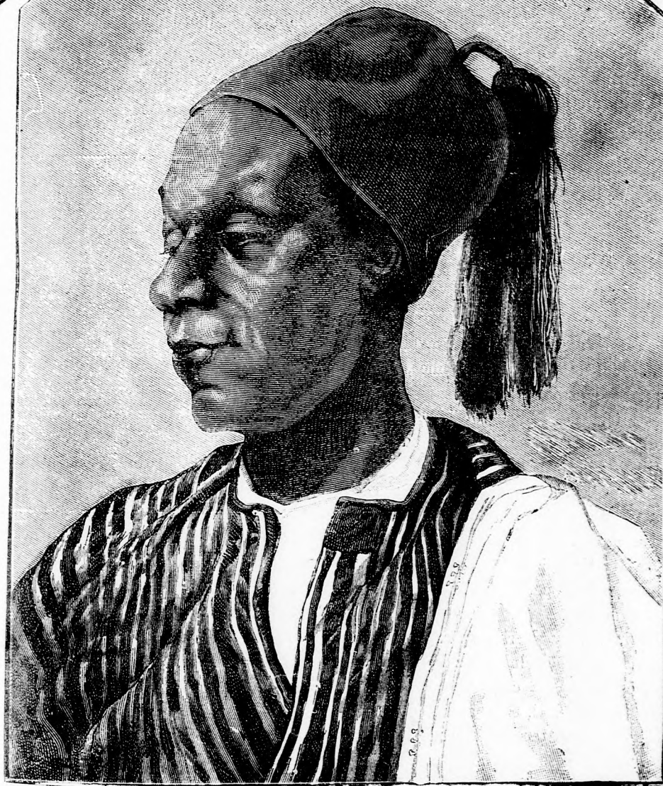
JUSZUF. (Lásd a 46. lapon.)