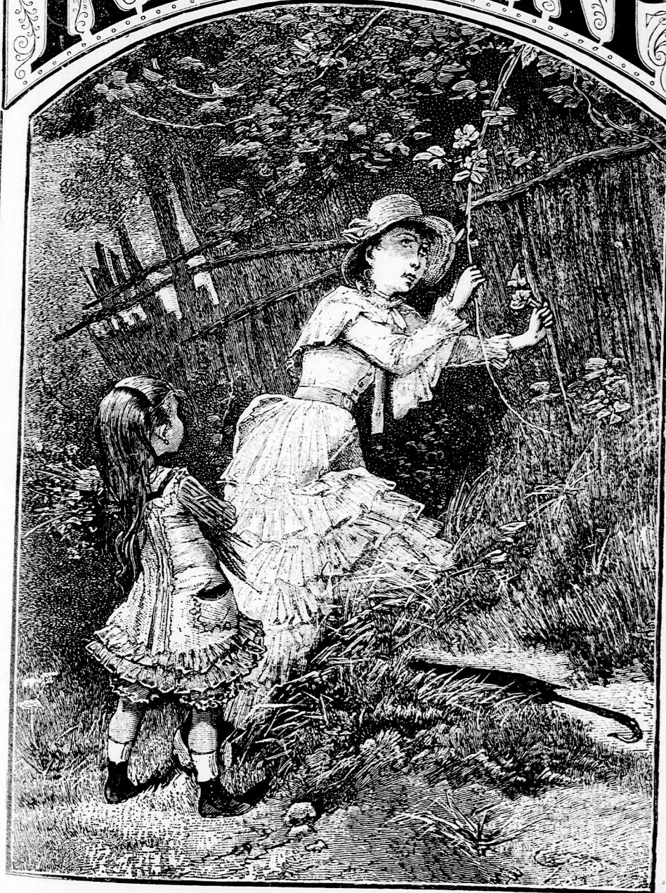
VADRÓZSA. (Lásd a 102. lapon.)