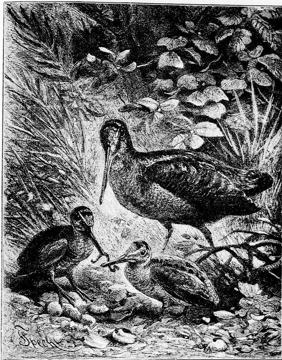
OSZTOZKODÁS. (Lásd a 102. lapon.)