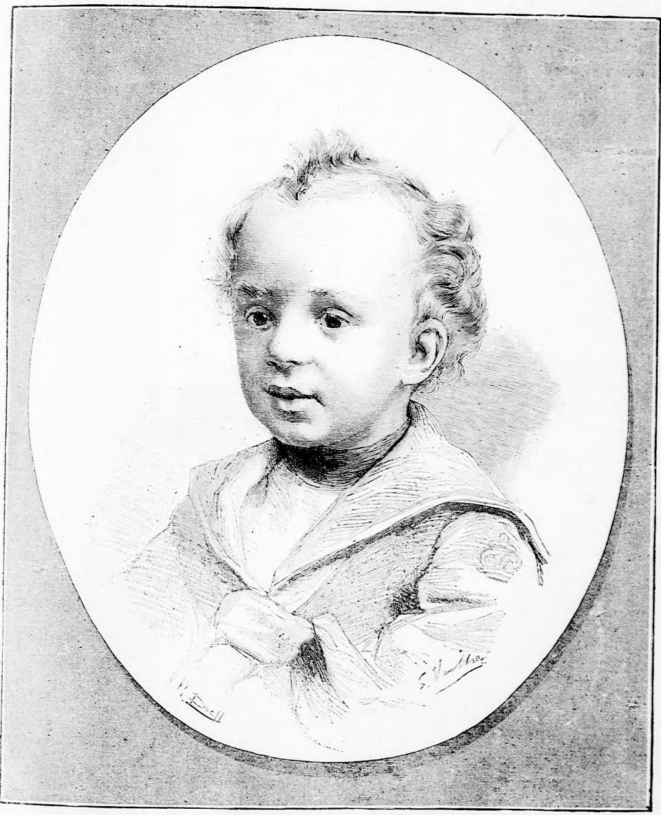
A LEGKISEBB KIRÁLY. (Lásd a 103. lapon.)

Tamás? ett, hogy uj növen- elt kény- jelenteni. elesápadt. át, Ernő em akart ás. Ernő ta ugyan, y a dolog,