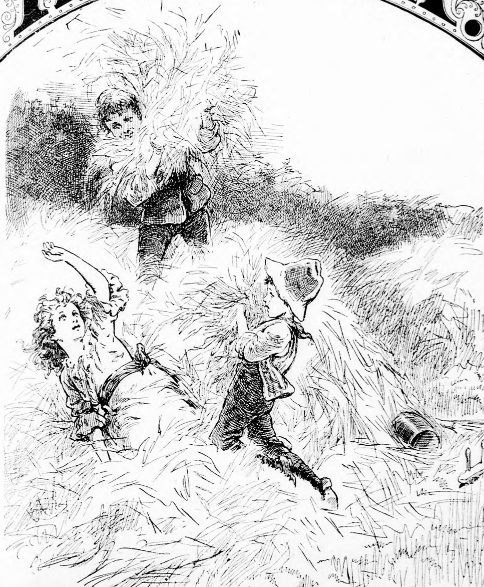
CSÉPLÉS. (Lásd a 138. lapon.)