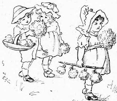
A KIS GRATULÁNSOK. (Lásd a 143. lapon.)