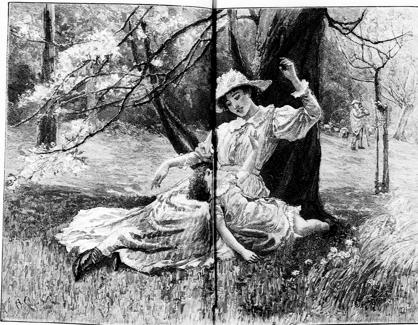
NYÁRI DÉLUTÁN. (Lásd a 148. iapon.)

Nézett, sokáig nézett oda, már szinte elálmosodott bele. Ugy félig-meddig arra