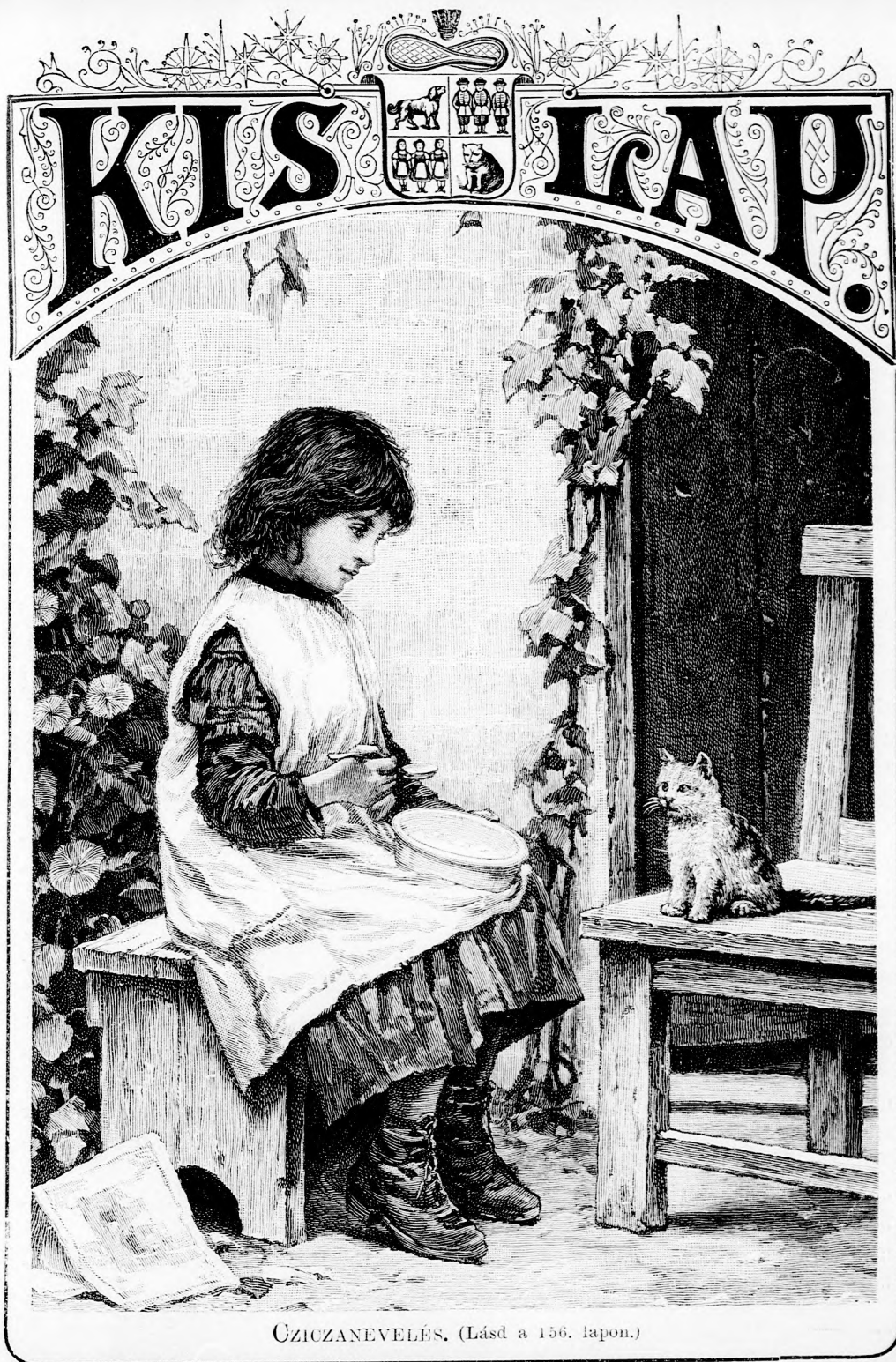
ÜZICZANEVELÉS. (Lásd a 156. lapon.)

XLIII. kötet, 10. szám. Ára negyedévre 1 frt 40 kr. Egyes szám ára 12 kr. 1892. szeptember Megjelen hetenkint egyszer, 16 oldalon.