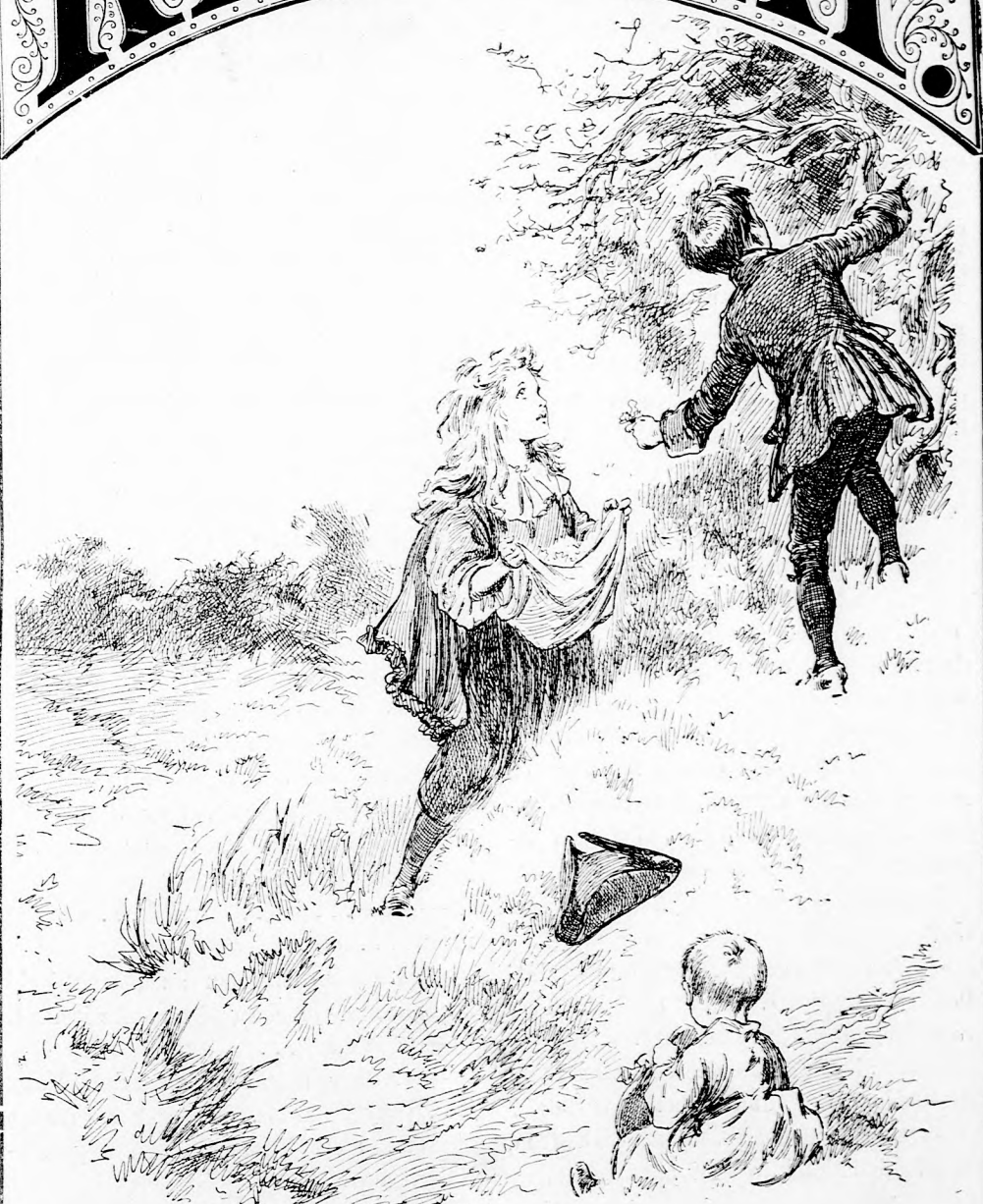
TILOSBAN. (Lásd a 164. lapon.)

Ára negyedévre 1 frt 40 kr. Egyes szám ára 12 kr. 1892. szeptember 11-én. XLIII. kötet, 11. szám. Megjelen hetenkint egyszer, 16 oldalon.