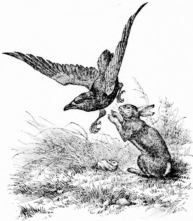
... VÉDTE A FIÁT. (Lásd a 173. lapon.)

kája zárját és kicseni az ember zsebéből a holmit, mint a legügyesebb zsebmetsző. Mert a legnagyobb gyönyörűsége abban telik, ha lophat. Csupa kedvtelésből lop, csupa olyan tárgyakat, melyeknek nem veheti semmi hasznát. Elviszi még a fogkefét is, pedig hát a fogát biz ő nem szokta sikálni. És amit egyszer