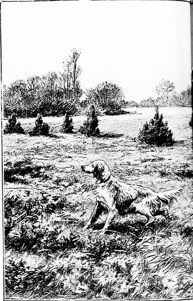
ÜNNEPIES VIZSLA (a 271. lapon.)

A legfiatalabbik tehát nem is gondolkozott sokáig, hanem sebtiben így szólt: