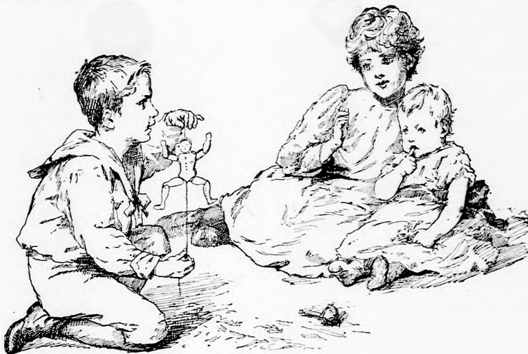
FÉL A BABA.

— Jaj de gyáva kis baba! kaczagott Gabi. No, ebből sem lesz huszár!