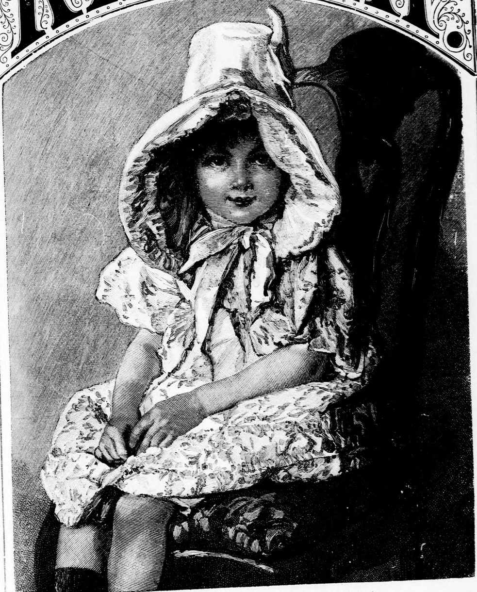
A NAGYMAMA KUKULÁJA. (Lásd a 270. lapon.)

XLIII. kötet, 17. szám. Ára negyedévre 1 frt 40 kr. Egyes szám ára 12 kr. 1892. október 23-án. Megjelen hetenkint egyszer, 16 oldalon.