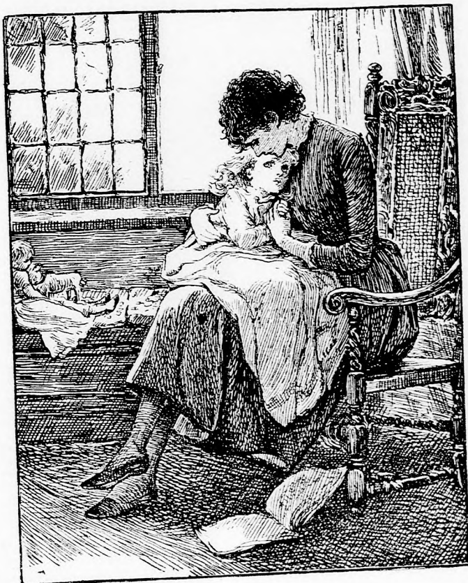
KIS BETEG. (Lásd a 271. lapon.)

De törődött Ernő és majdnem fölkiáltott, mikor egyszerre azt látta hogy a leány-sereg nem megy tovább, hanem bevonul egy nagy házba. Ezt várta, ezt leste ő.