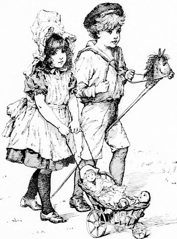
KI A SZABADBA! (Lásd a 304. lapon.)

Ernő bizony maga sem valami jelesül érezte most magát a maga bőrében. De már csak magának köllött végeznie a dolgát. Elszánt léptekkel haladt végig a hosszú folyosókon. A fiuk közül nem