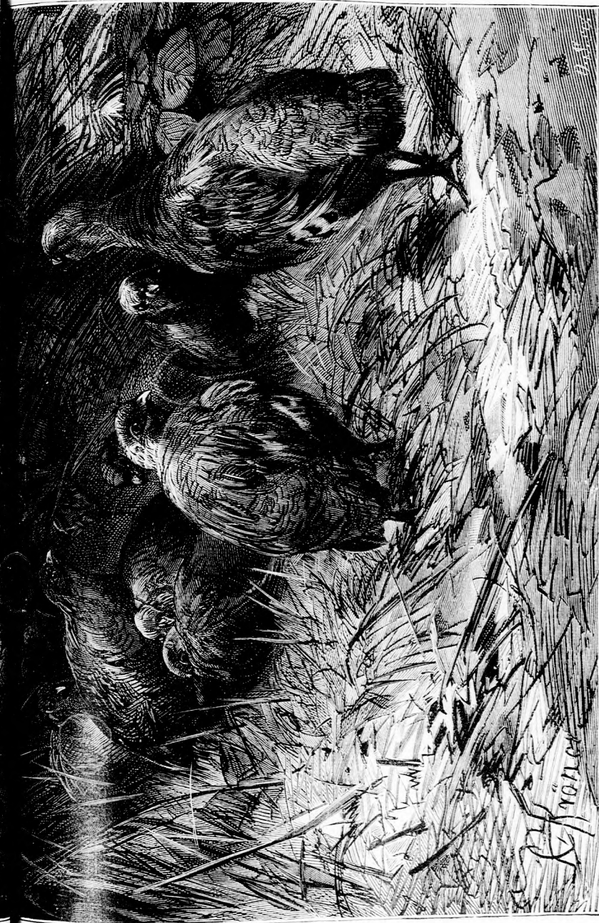
KÖZELEDŐ VESZEDELEM. (Lásd a 303. lapom.)