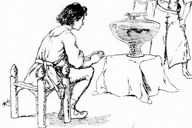
... BÁMULT A CSODA-HALRA.

— No hát csak rajta, fogj hozzá szaporán. Nyulj bele, fogd meg hát, te süvölvény! gúnyolódtak az udvarbeliek.