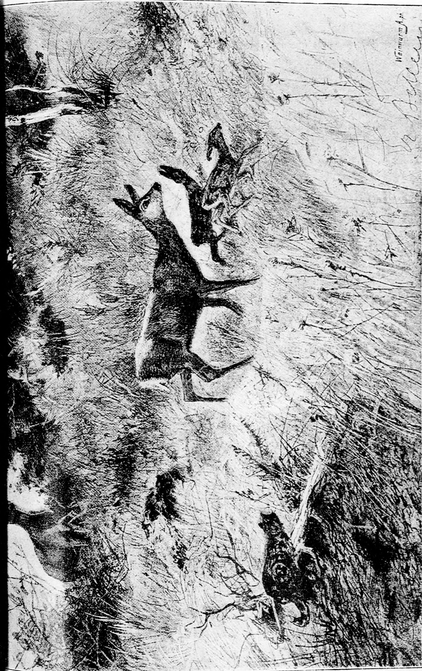
ŐZ-CSALÁD. (Lásd a 336. lapon.)