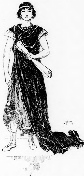
A BÖLCS BERTÓK.

Z. J. levelét, ennek gondatlan formája miatt, nem vehetem figyelembe. F. b.