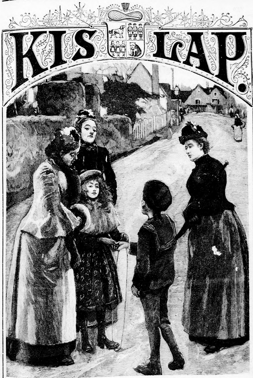
... FESZESEN NYUJTOTT KEZET. (Lásd a 326. lapon.)