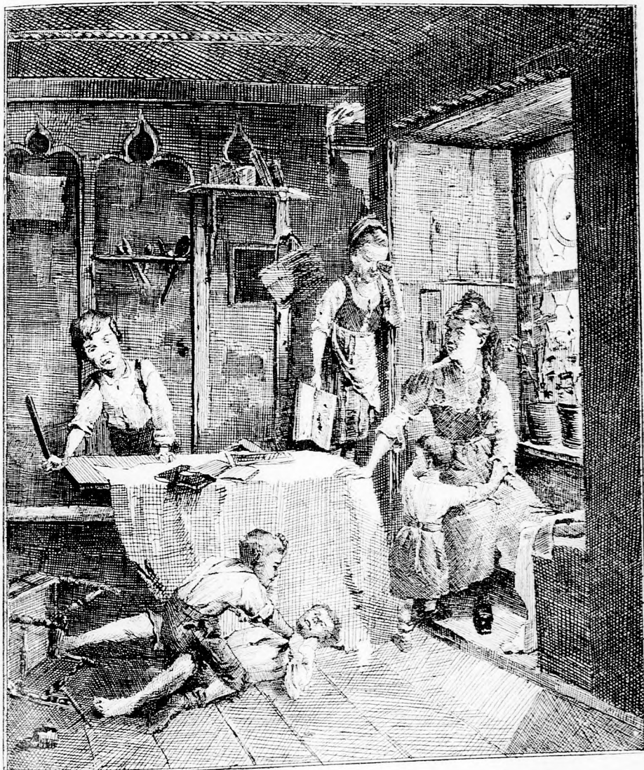
A HARMADIK. (Lásd a 331. lapon.)