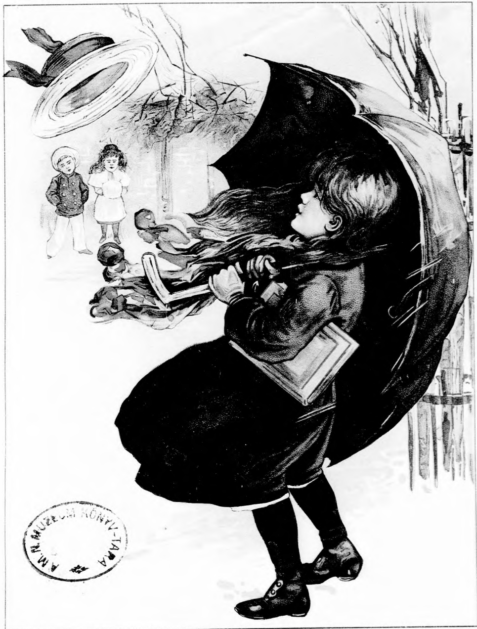
A »KIS LAP« karácsonyi műmelléklete.