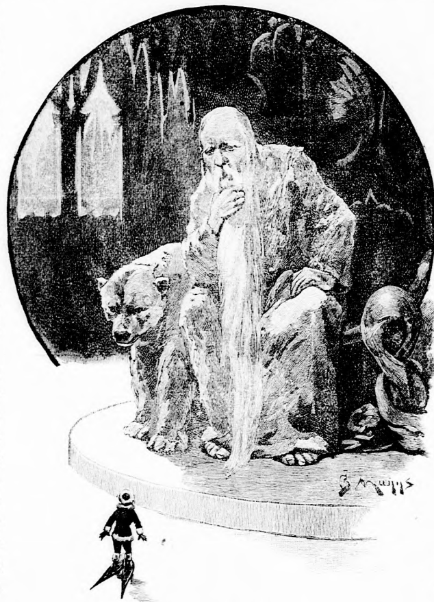
... SZAKÁLLA A FÖLDIG ÉRT. (Lásd a 123. lapon.)

— Oh mennyire bánom, hogy elégedetlen voltam az én szép kedves hazámmal! Megérdemlem a büntetést!