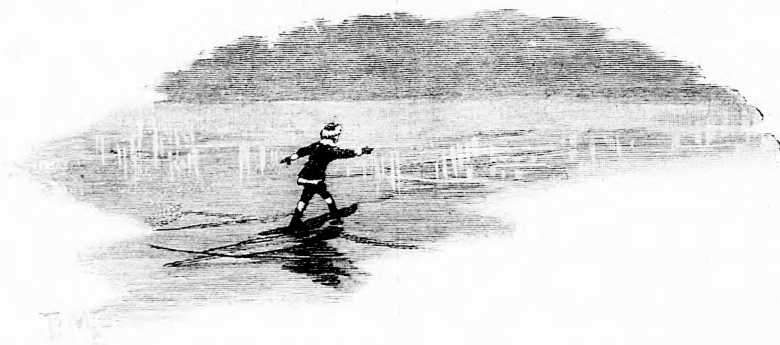
SZÜNET NÉLKÜL TOVÁBB . . . (Lásd a 121. lapon.)

— Nem lehet az! Még tél ideje van. Még én korcsolyázni akarok! Tegnap is