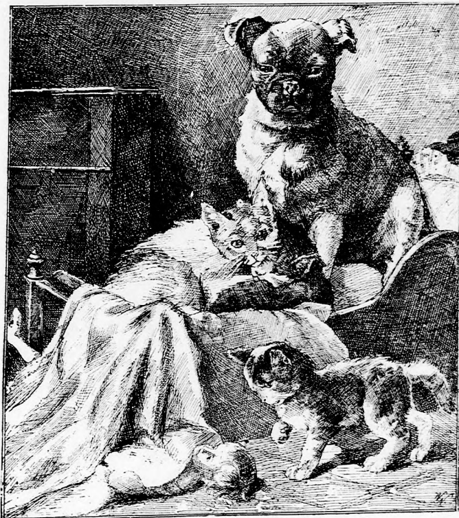
A BITORLÓK. (Lásd a 125. lapon.)

Béla ügyesen rajzolt s egy papiros-darabra gyorsan oda pingált egy torz-alakot, melytől a már ugysis fölízgatott Dorinka meg is ijedhetett. Ijeztően meredt szemü szörnyeteg öreg asszonyt rajzolt pápaszemmel, hegyes állal, pupos háttal, kendő helyett