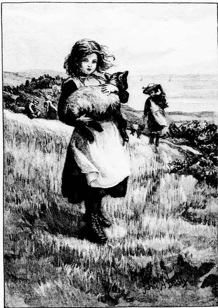
EGY BÁRÁNYKÁT ÖLBE KAPOTT. (Lásd a 219. lapon.)