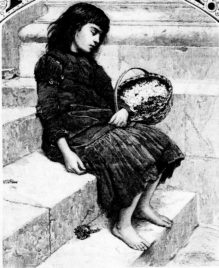
... FÁRADTSÁGTÓL ELSZENDERÜLT. (Lásd a 218. lapon.)

XLIV. kötet, 14. szám. Ára negyedévre 1 frt. Egyes szám ára 12 kr. 1893. április 2-án. Megjelen minden vasárnap, 16 oldalon