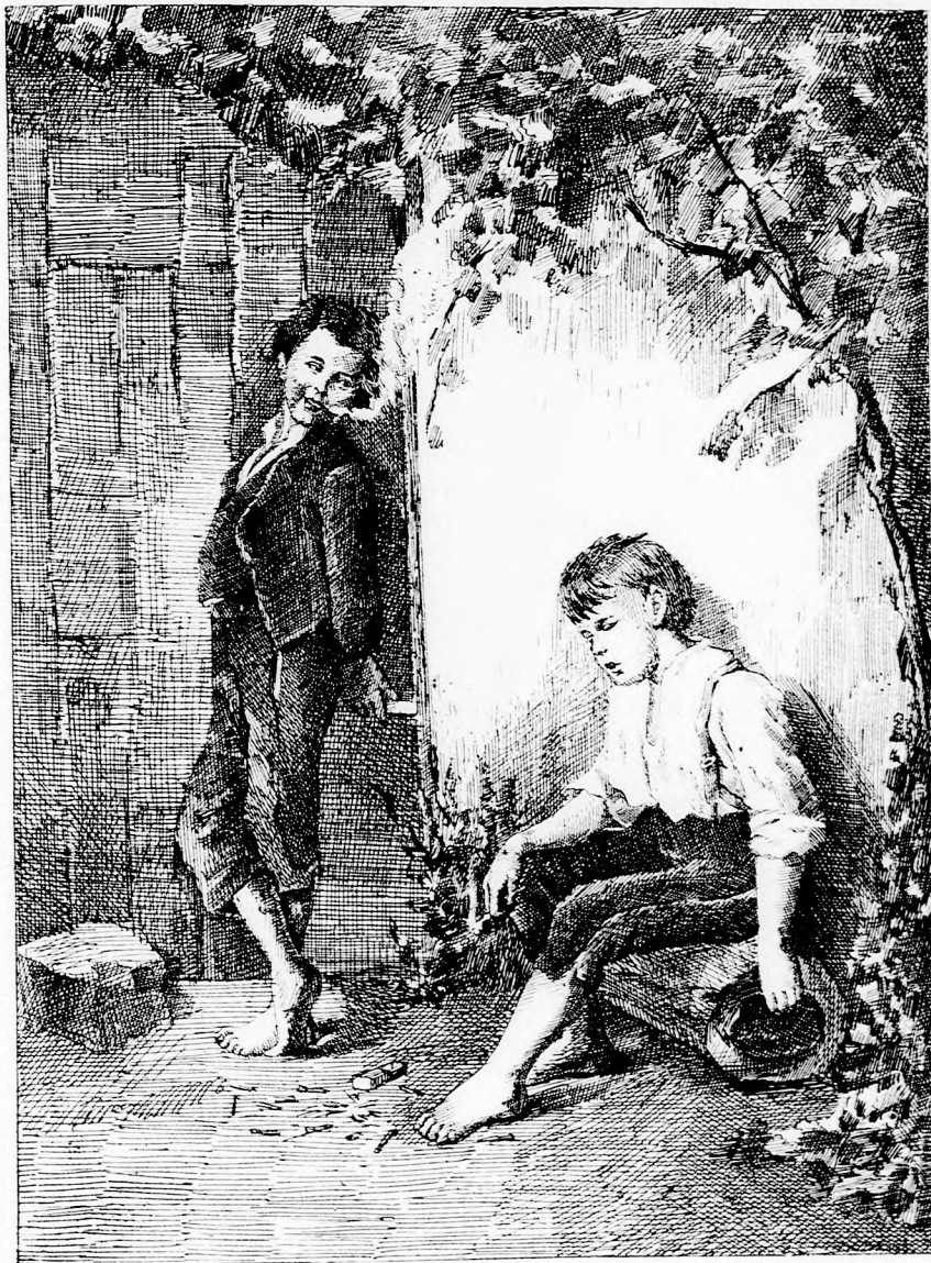
EGY PICZULÁNYI BAJ. (Lásd a 291. lapon.)