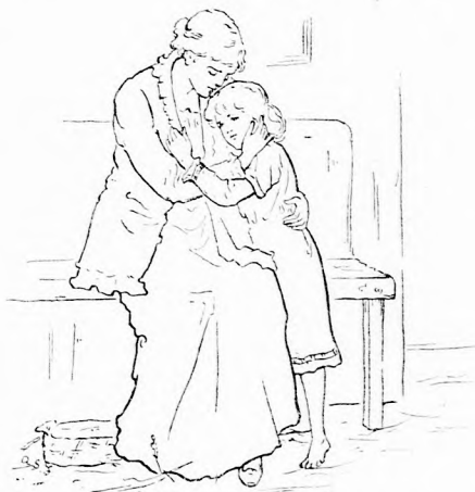
. . . MAGA IS ELSÍRDOGÁLT.

Az első napon Elek bácsi és a felesége maguk is nevettek a fiuk játékán. A második napon Elek bácsi nyájasan intette őket, hogy módjával jó ám a játék is. A harmadik napon, mikor tüzi játékot rendeztek és majd felgyújtották a pajtát, már meglehetősen komolyan megdorgálta őket, amiből egyébiránt csak az következett,