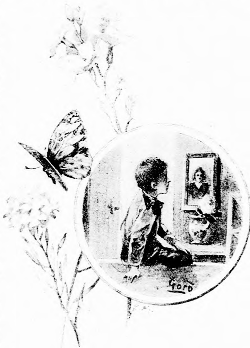
... EGY KIS VIRÁGTARTÓBAN OTT POM- PÁZOTT A RÓZSA. (Lásd a 287. lapon.)

— Te Samuka! mondtam neki egyszer félig-meddig haragosan, hogy nem akart