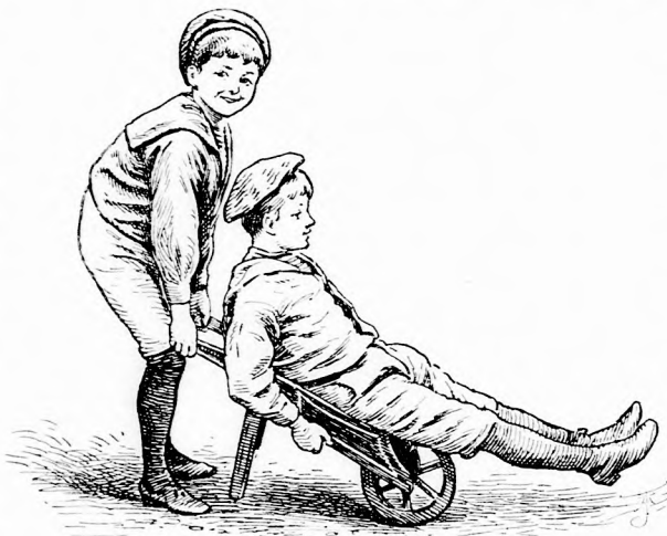
... BELEÜLT A TALIYIGÁBA. (Lásd a 290. lapon.)