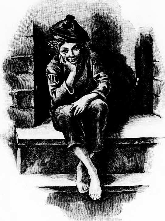
MATYIKA TAVASZA. (Lásd a 299. lapon.)

Kálmán (kezet fog Jolánkával.) Kedves Jolánka, akit az én László pajtásom test-