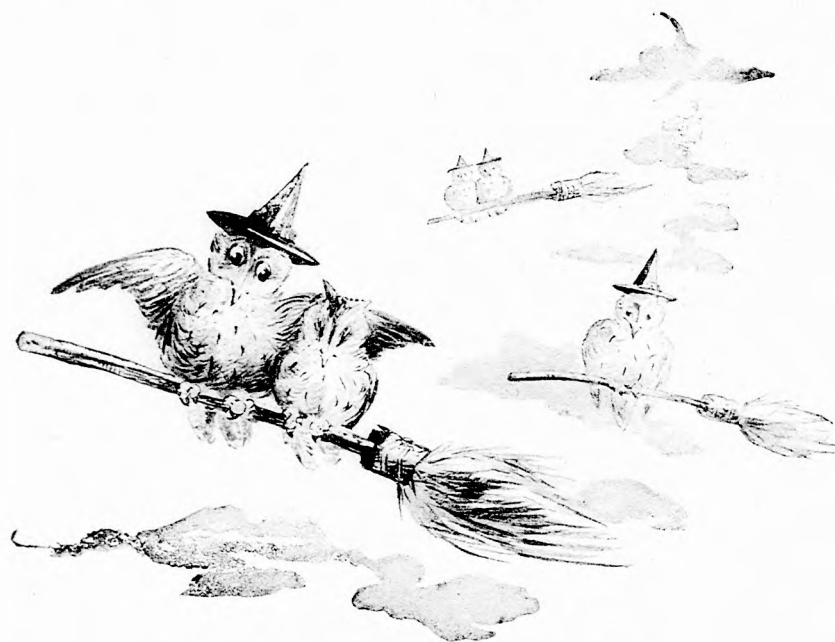
... KI PÁROSAN, KI MAGÁNYOSAN. (Lásd a 302. lapon.)

— Azt nem szabad tenned! Azt nem engedem!