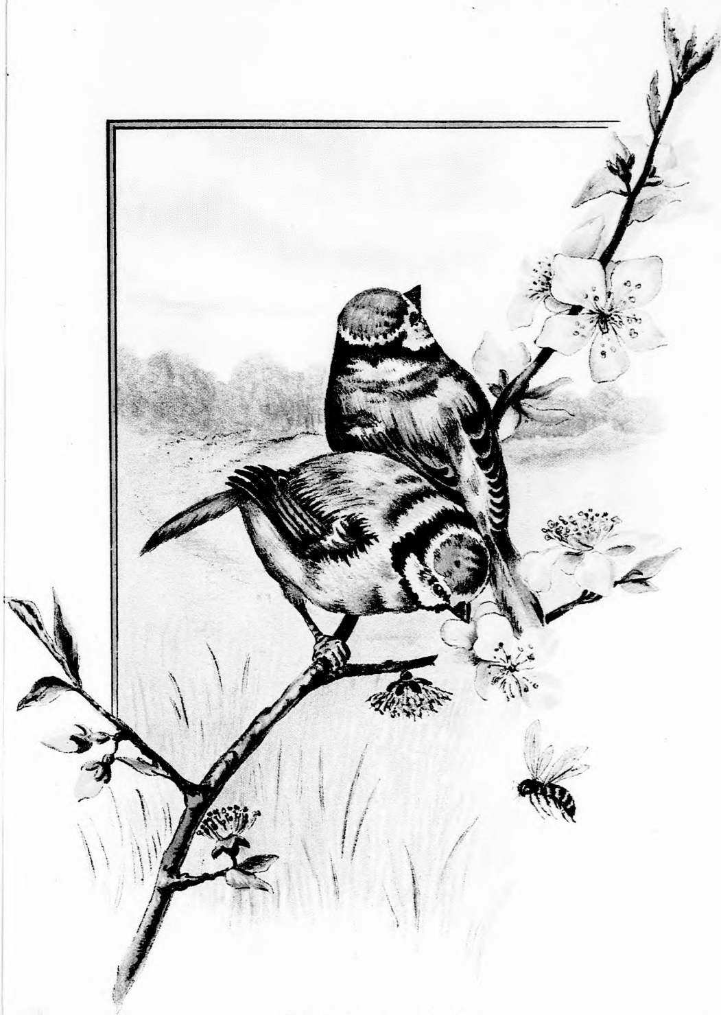
Két kis czinke.