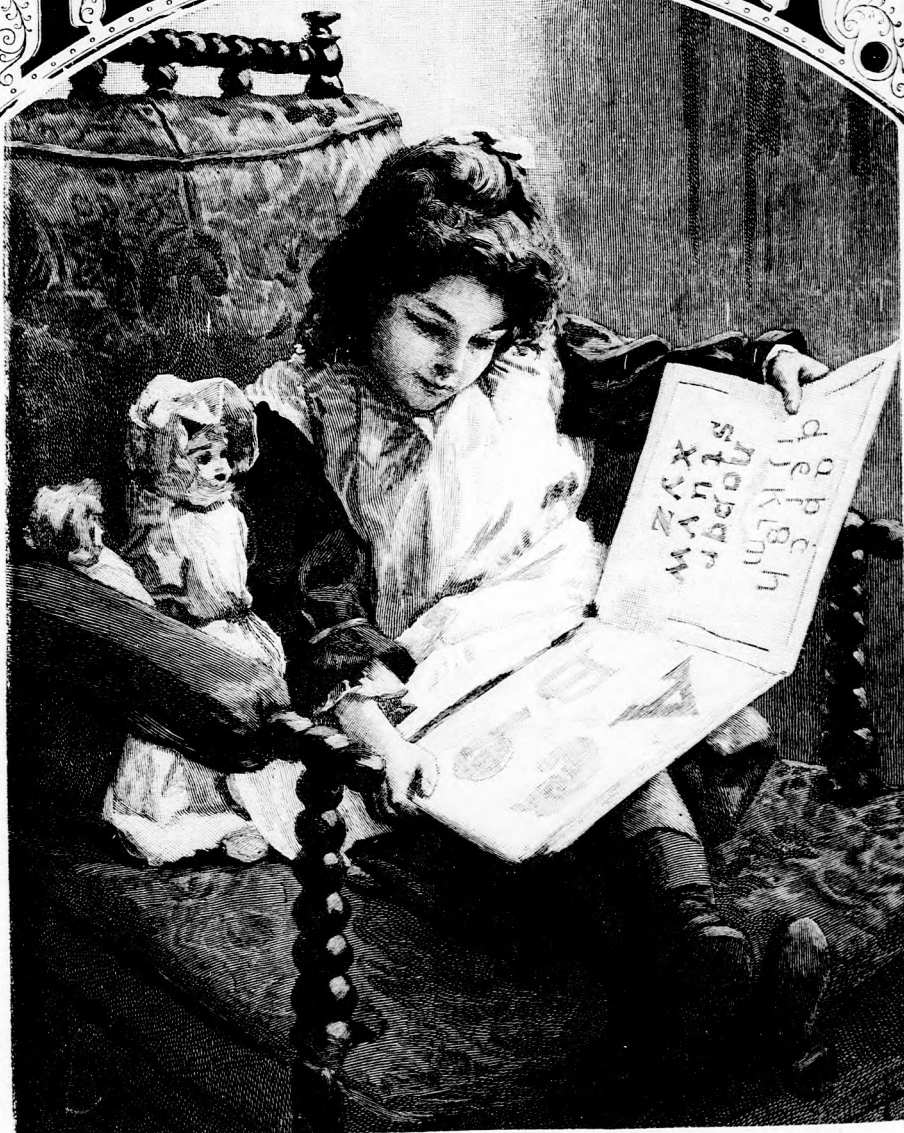
TANÍTÁS. (Lásd a 306. lapon.)

XLIV. kötet, 19. szám. Ára negyedévre 1 frt. Egyes szám ára 12 kr. Megjelen minden vasárnap 16 oldalon.