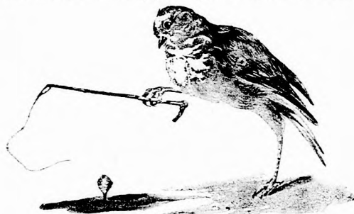
. . . PÖRGETTYÜT CSAPKODOTT.

Madárnak nézni engem! Ez már csak bolond história! De az is furcsa hogy az a halász-fecske legalább is akkora volt mint én, sőt talán még nagyobb. Ugyan hatalmas szárnyasok élnek erre felé. Mert én csak nem lettem kisebb? De mekkora lehet