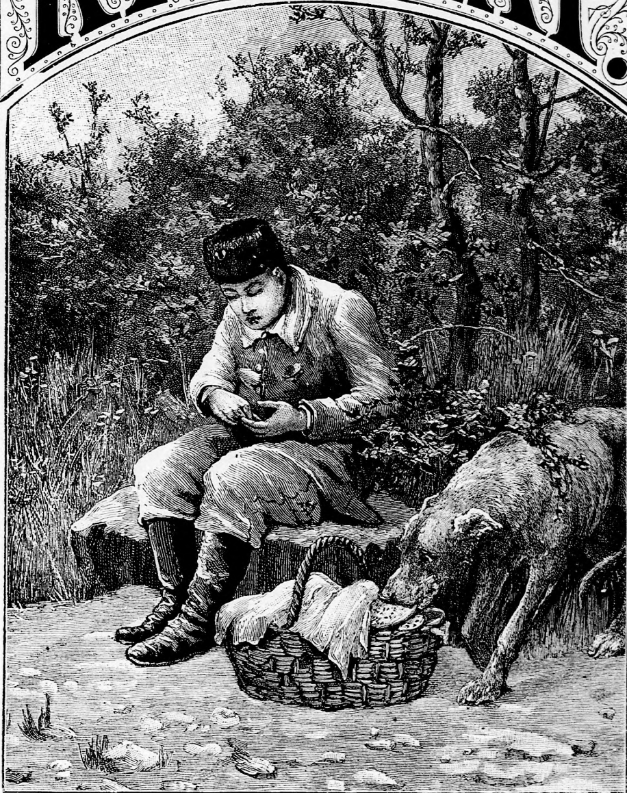
A MEGDÉZSMÁLT KOSÁR. (Lásd a 39. lapon.)