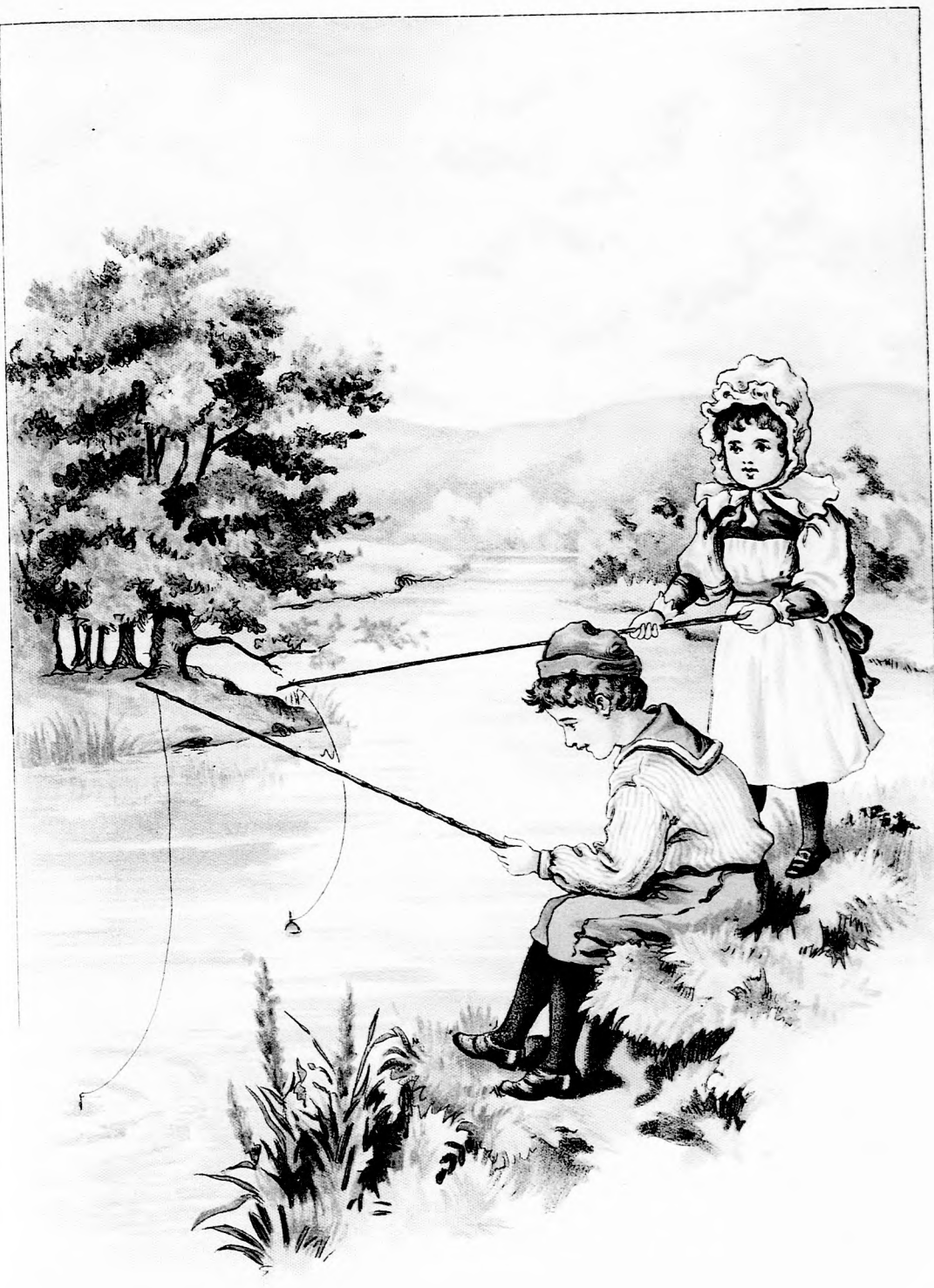
Horgászat a Sajó partján.

próbálkozol út müved-e, onnan. Ha eretét érde- sel vettem nyt kaptál. gyon bajos es is elöt- hetenként is lányom, es mondás órakoztató kellemes, ; minden- -pal pedig er Ernő. ók sorába. a határon, tekintetből bajt okoz- dig, melyet sem tettél mihamar meggörbi- ínt a hogy óbb fog a ni. És ha czió, van nben nem . A »Kis mel vettem nán. Nem kat, mert a kérdése- a szavak ztük: Bod er Emma ttel osztó- ga halot- vagy már az előbbi a »Kis az ilyen kegyele- fájdalma- kis tör- leszünk, y kicsike l, mert a em mindig . Amiket el figyel- bi dolgo- atkozásai- igazságos. olvastam ságát. —