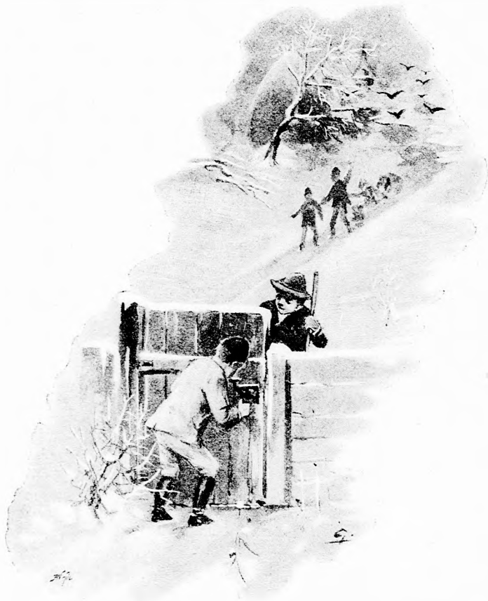
... CSÓKOT NYOMOTT A FAGYOS VASRA. (Lásd a 35. lapon.)

— A legjobb, ha kerülöd, szakítá félbe Biri néni; akármit tennél, még ha a lelkedet is oda adnád neki, nem bánná, mégis csak rosszban törné a fejét. Nem köll neki