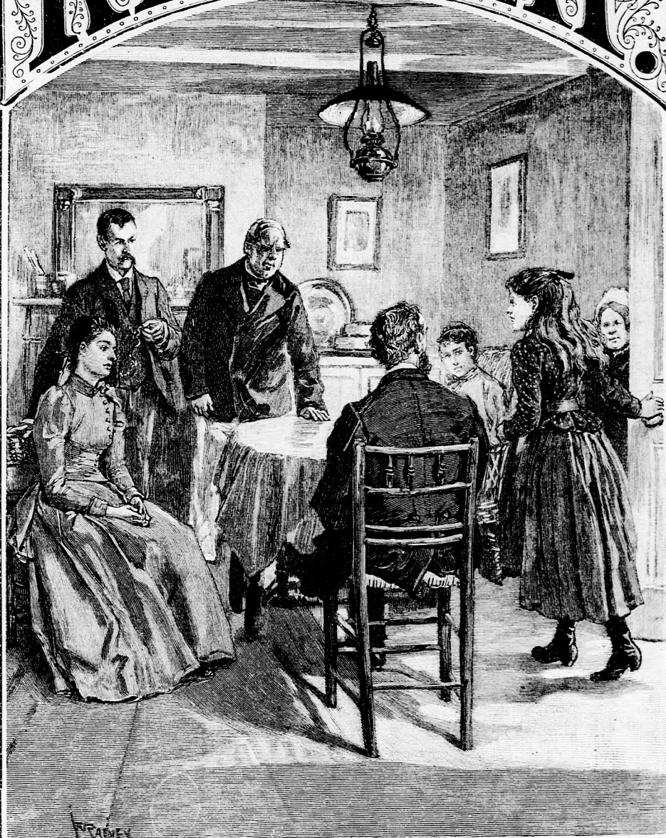
... ÁRTATLAN KÉPPEL NYITOTT BE. (Lásd a 66. lapon.)