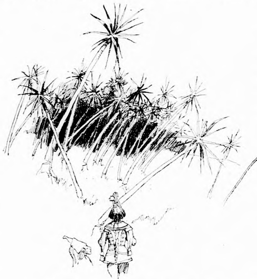
... EGÉSZ SOR FA FÖLEGYENESEDETT.

Három nap mulva a fő-erdőmester újra megjelent. A saját édes apja sem ismert volna rá. Ugy lesoványodott, hogy minden