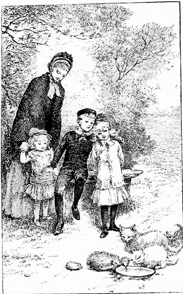
ODA GYÜLTÜNK ÉS NÉZEGETTÜK. (Lásd a 199. lapon.)

koztak meg? szólt Janka nénikém, küssé elmosolyodva a furcsaságon. No, majd apácska elintézi a többit.