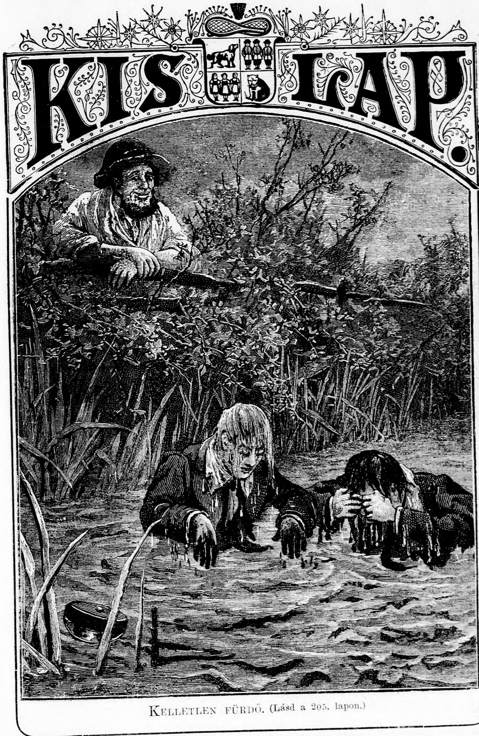
KELLETTLEN FÜRDŐ. (Lásd a 205. lapon.)

XLV. kötet, 13. szám. Ára negyedévre 1 frt. Egyes szám ára 12 kr. 1893. szeptember 24-én. Megjelen minden vasárnap 16 oldalon.