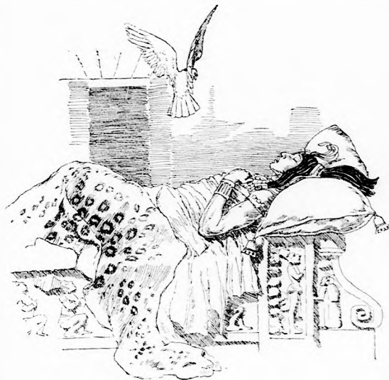
... GALAMB REPÜLT BE. (Lásd a 204. lapon.)

A galambok példájára köll cselekednünk. Megolvastatjuk, hány fa van az erdőben, mindegyik mellé egy-egy favágót és kellő számú napszámot állítunk. Aztán valamennyi fát egyszerre köll levágni, még pedig úgy, hogy a levágott fa ne is dőljön a földre, hanem a napszámok azonnal kapják föl és vigyék messzire le a völgybe nagy máglyába s ott égessék el. Így nem nőhetnek újra visz-