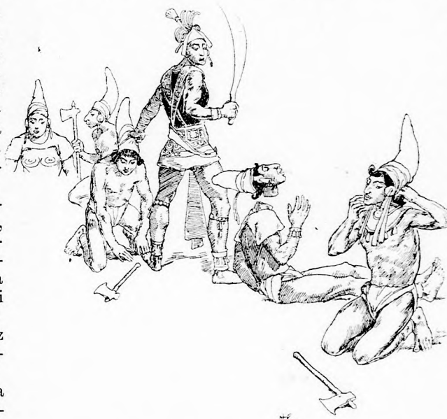
... KÉNYELMESEN HELYRE IGAZITOTTA.

Volt nagy sirás és jajgatás. De csak addig, míg a fő-hőhermester az első egykét favágónak leütötte a fejét. Mert ekkor történt még csak furcsa dolog. Ekkor ámult el még csak igazán a hatalmas király, és bizony-bizony úgy titkon kissé borzongani is kezdett, ami még soha sem esett meg rajta.