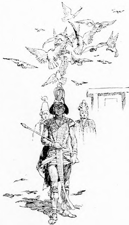
... A FEJE FÖLÖTT LEBEGVE.

S a fiatal király híu maradt jó szándokához. És a hány-szor kilépett a palotából, mind annyiszor elő röppent az erdőből néhány galamb és a feje fölött lebegve kísérte, valamerre járt. Nem is hívták másképp, csak »a galamb király«-nak és nagy hatalmával boldoggá téve népét, boldogan uralkodott sokáig és még ma is élne, ha már rég meg nem halt volna.