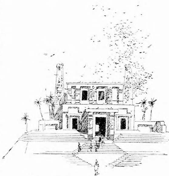
... NAGY SEREG GALAMB RÖPPENT ELŐ.

— Igaz, csak kegyetlenségre gondoltam mindig, gonoszul használtam hatalmamot!