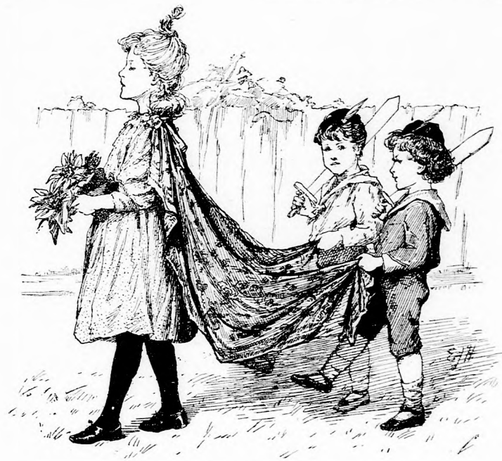
OLGA KIRÁLYNŐ. (Lásd a 199. lapon.)

Ezen aztán az öreg is nevetett. Egyéb baj nem is következett, csak hogy Mimike néhány napig ugyancsak bágyadt volt. No,