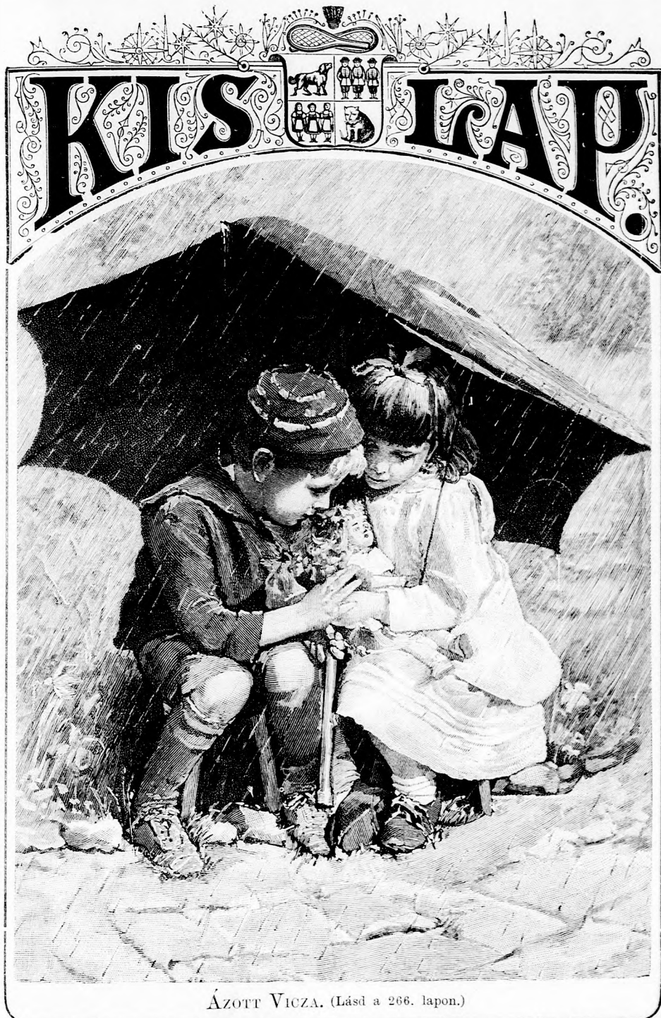
ÁZOTT VICZA. (Lásd a 266. lapon.)