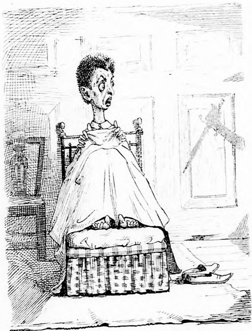
RETTENTŐ LÁTOMÁNY. (Lásd a 265. lapon.)

Bence nem kérte magát, hanem gyorsan bement a házba. Rózsika, maga sem tudta jól, hogy miért: de jobb szeretett