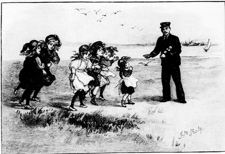
ZORKA LEVELE. (Lásd a 366. lapon.)

Amint ezt mondta és a koszorura rátaposott, sístergő láng csapott fel a koszo-