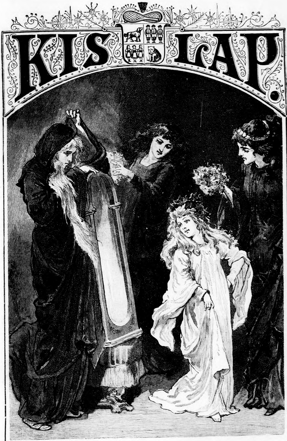
... Gyönyörködve nézte magát a tükörben. (Lásd a 356. lapon.)

XLV. kötet, 23. szám. Ára negyedévre 1 frt. Egyes szám ára 12 kr. 1893. december 3-án. Megjelen minden vasárnap 16 oldalon.