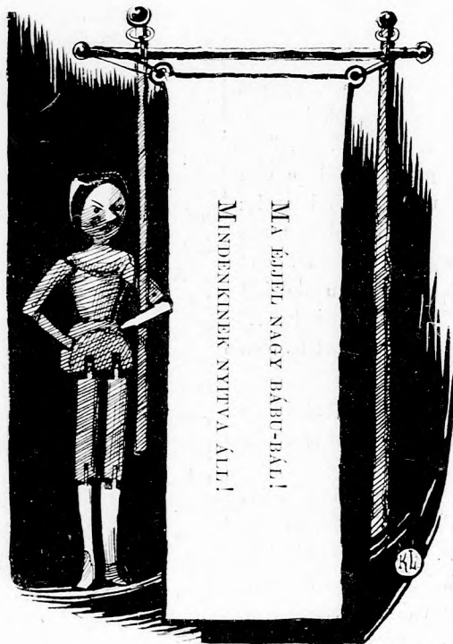
... LOBOGÓT TÜZÖTT KI. (Lásd a 362. lapon.)

Aztán egy kicsit pöröltek, de csak úgy barátságosan, a kenyér és a sajt fölött, mert Palkó csakugyan nem érte be anyival, a mennyit Toncsika adott neki, hanem fogta a bicskát és úgy bele kanyarított a sajtba is, hogy a nagyapó holnap, tudom, ugyancsak fog sopánkodni a kenyér pusztítás miatt. Palkó aztán fölrakta a boltablakra a táblákat, becsukta az ajtót és elment aludni; Toncsika pedig még ott maradt, hogy egyet-mást helyre rakosgasson.