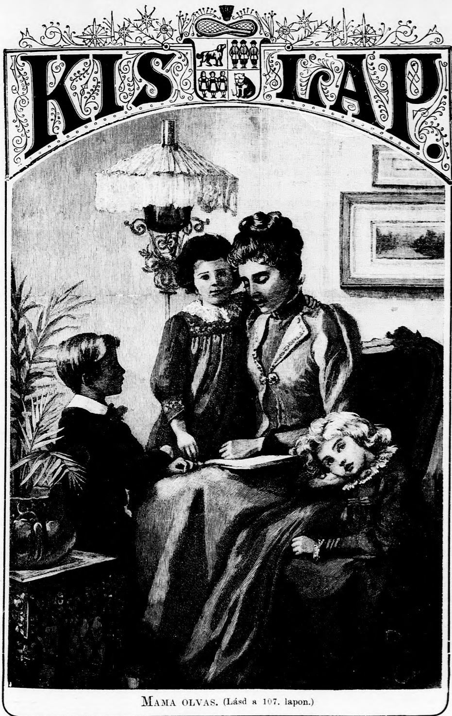
MAMA OLVAS. (Lásd a 107. lapon.)

XLVI. kötet, 7. szám. Ára negyedévre 1 frt. Egyes szám ára 12 kr. 1894. február 18-án. Megjelen minden vasárnap 16 oldalon.