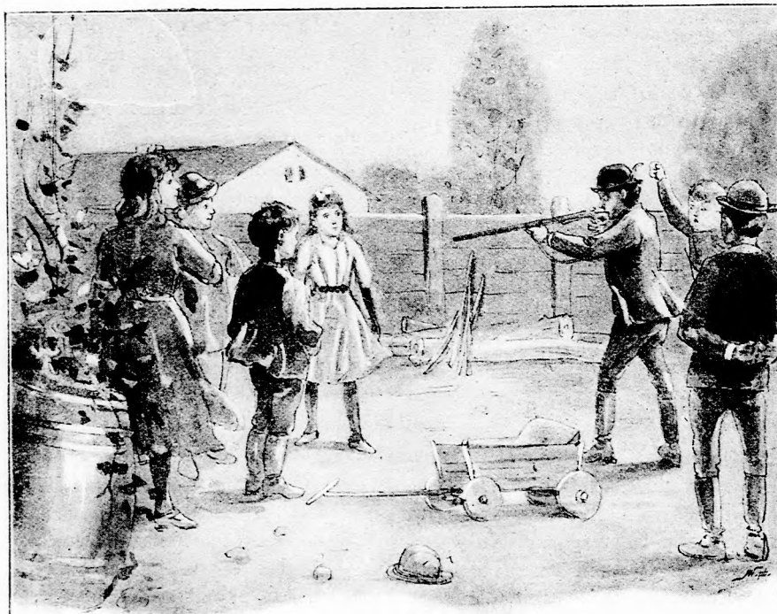
... FÖLEMELTE A PUSKÁT ÉS CZÉLZOTT. (Lásd a 155. lapon.)

— Ej, rosszul lesz! Nem mer, és ezért nem akar! Ha nem teszi, haragszom rá örökre!