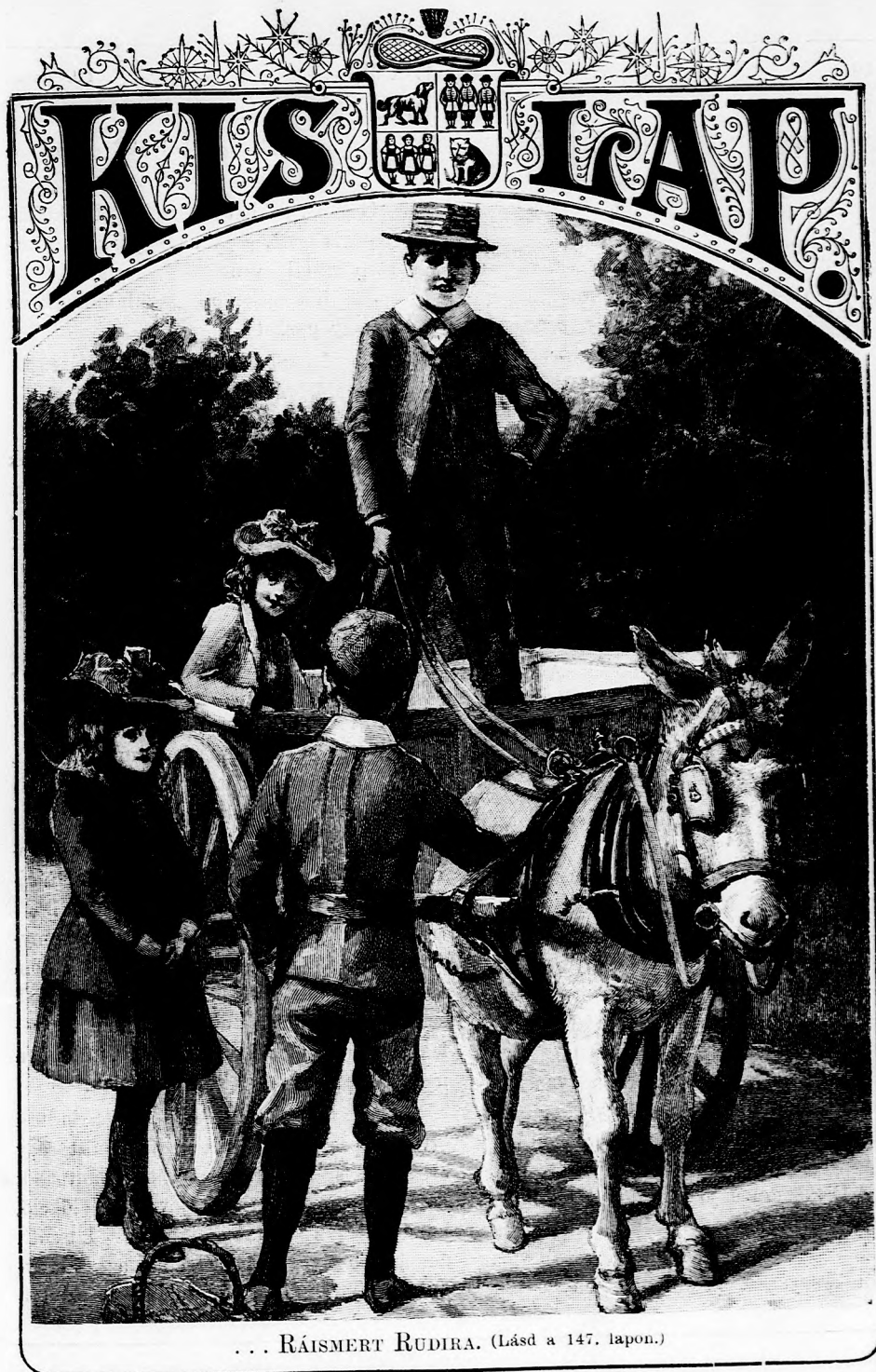
... RÁISMERT RUDIRA. (Lásd a 147. lapon.)