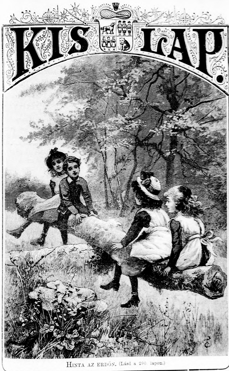
HINTA AZ ERDŐN. (Lásd a 290. lapon.)