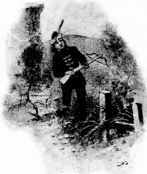
... SZÉP LÖVÉS VOLT.