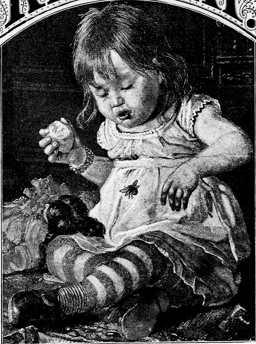
VESZEDELMEK VENDÉG. (Lásd a 71. lapon.)

XLVII. kötet, 5. szám. Ara negyedévre 1 frt. Egyes szám ára 12 kr. Megjelen minden vasárnap 16 oldalon.