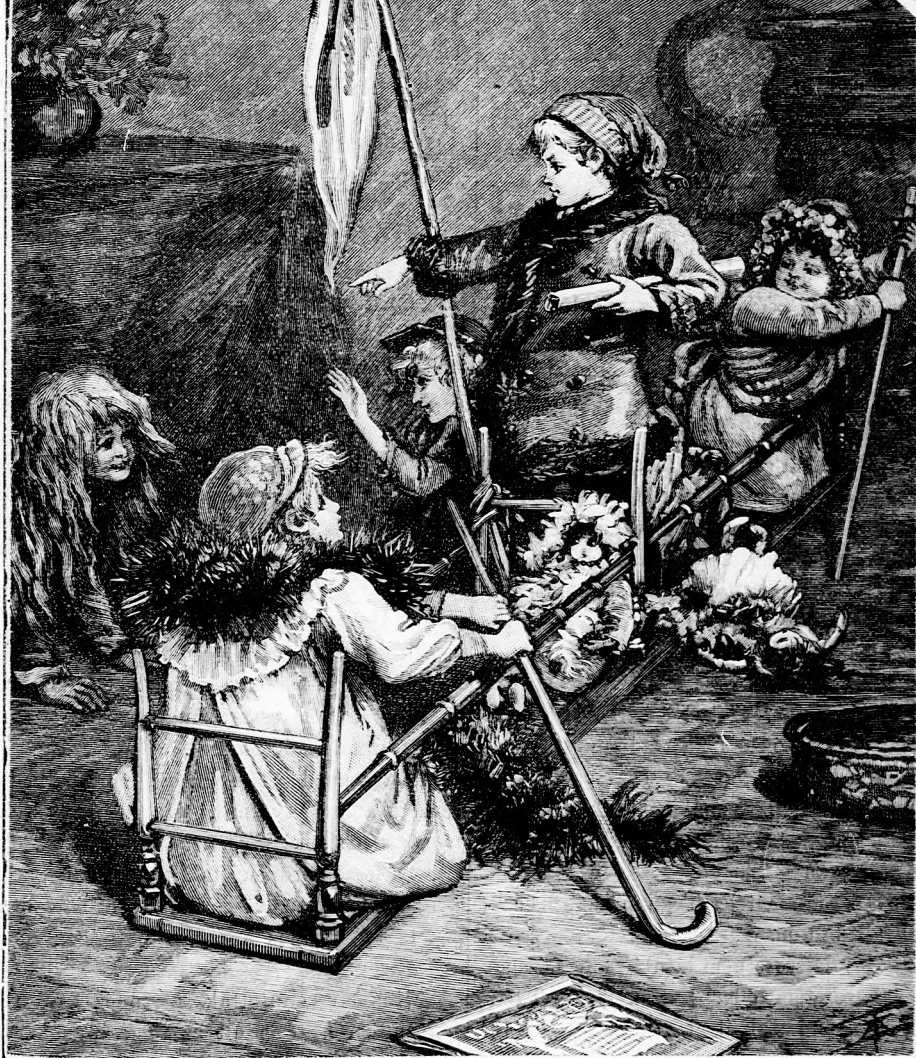
AMERIKA FÖLFEDEZÉSE. (Lásd a 334. lapon.)

XLVII. kötet, 21. szám. Ára negyedévre 1 frt. Egyes szám ára 12 kr. 1894. november 18-án. Meglenni minden vasárnap 16 oldalon.