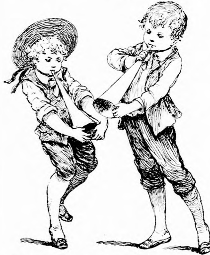
... HATALMAS TÜLKÖLÉST VITTEK VÉGHEZ. (Lásd a 347. lapon.)