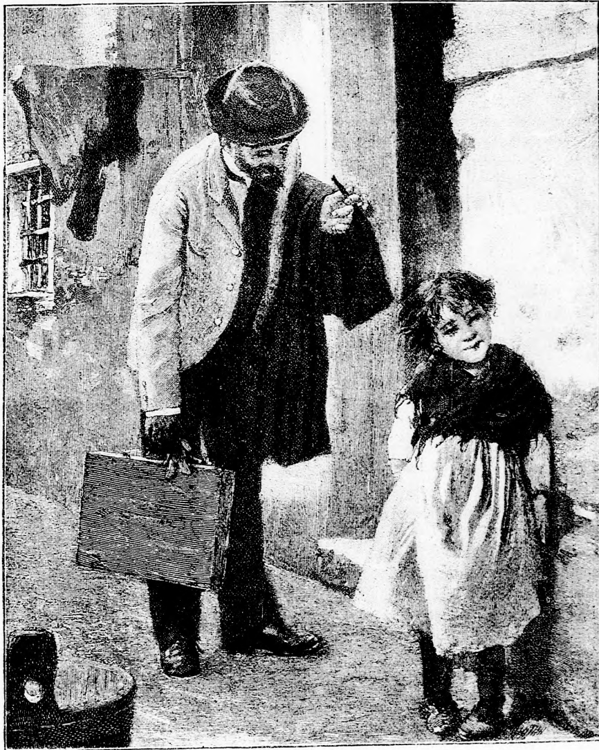
A PIKTOR MEG A JULCSA. (Lásd a 410. lapon.)

melltűt. (Kiveszi zsebéből és fölnyitva a tokot, mutatja.) Ugy-e szép? Igazi arany és igaz gyöngy . . . drága volt ám!