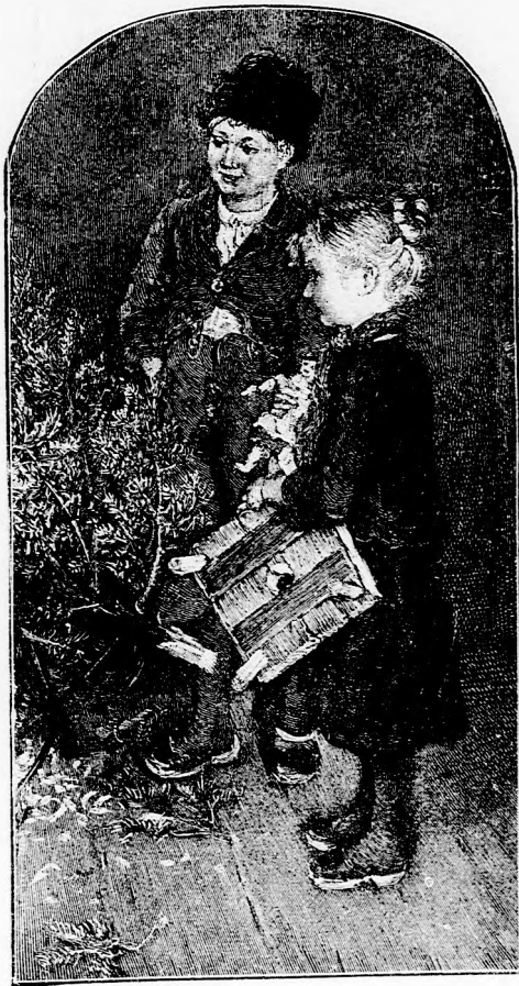
— JÓ LESZ TÜZREVALÓNAK.

— No, mára elég is volt, gondolá. Majd holnap újra kezdődik.