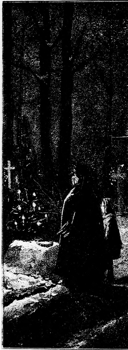
... OTT ZOKOGTAK. (Lásd a 413. lapon.)