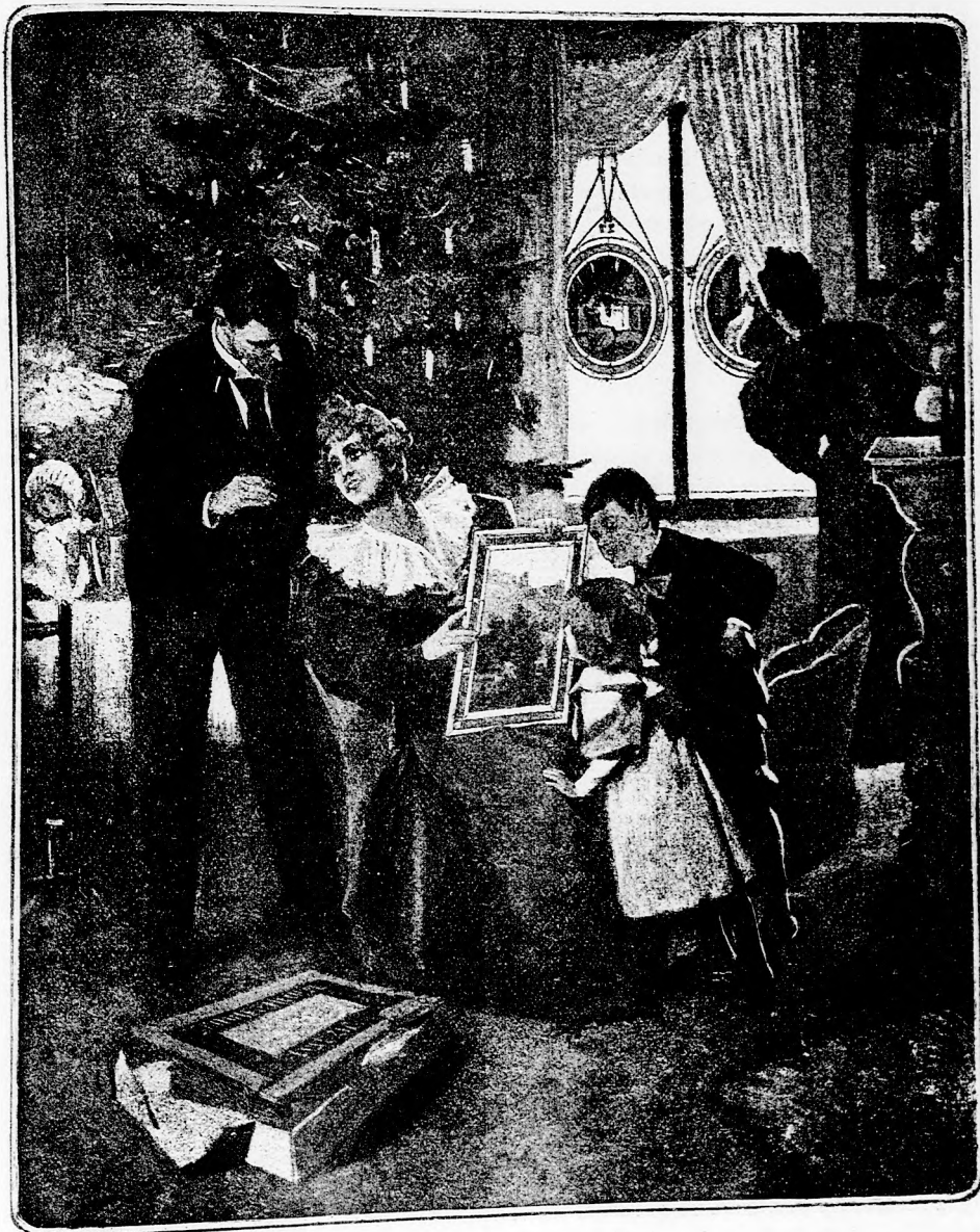
... ÖRVENDEZVE NÉZTÉK AZ AJÁNDÉKOKAT. (Lásd a 412. lapon.)