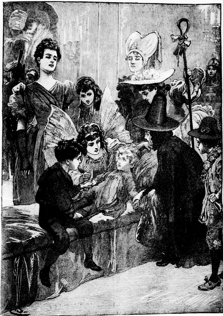
BŐZSIKE MEGHÖKKENVE NÉZETT A TÜNDÉRRE. (Lásd a 407. lapon.)

a néni, voltak. mnára. gindult calanul elláto- sze jó