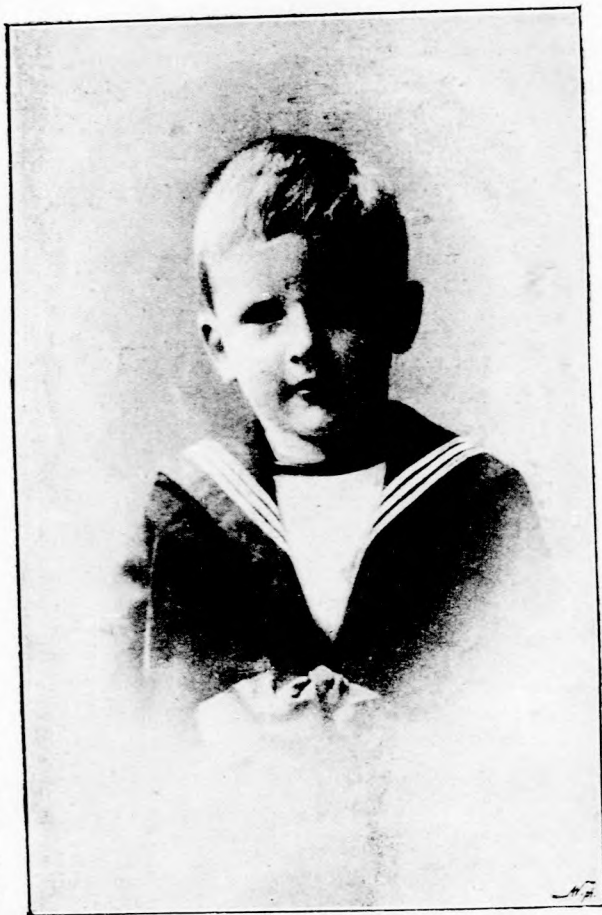
MAGYAR FIÚ IDEGENBEN. (Lásd a 21. lapon.)

Nem sokára az egész család együtt volt a reggelinél, csak Fruzsinka nem jelent meg. Évike, bár mennyire erőlködött, nem tudott olyan vidám lenni, amilyennek szülei látni szerették volna. Tudakolták is az okát s a nevelő el-