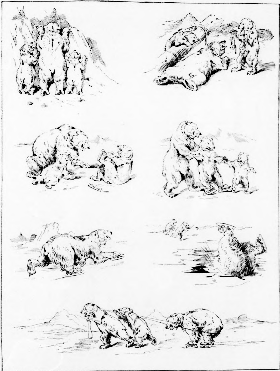
BOCS URFI KORCSOLYÁZÁSA. (Lásd a 21. lapon.)