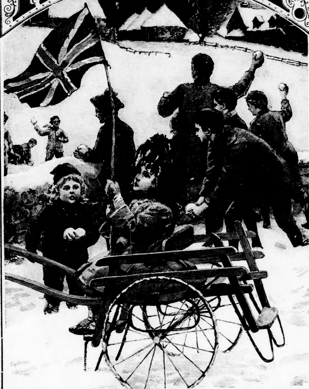
... BÜSZKÉN TARTOTTA A LOBOGÓT. (Lásd a 27. lapon.)

XLVIII. köt., 2. szám. Ára negyedévre 1 ft. Egyes szám ára 12 kr.