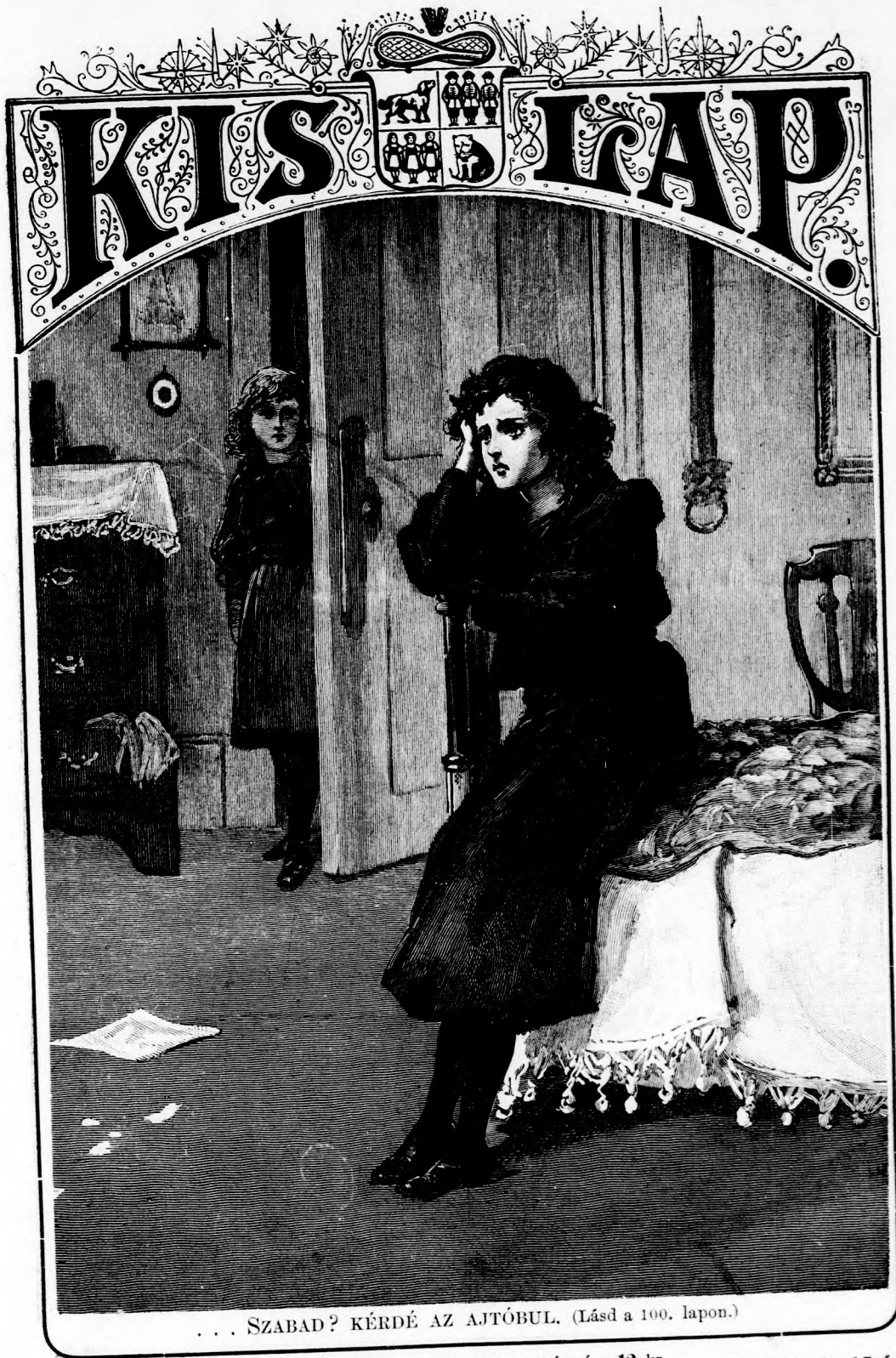
... SZABAD? KÉRDÉ AZ AJTÓBUL. (Lásd a 100. lapon.)