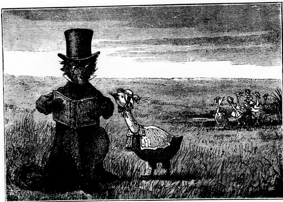
LIBUSKA LECZKÉJE. (Lásd a 102. lapon.)

— Meghiszem. Hát még ha csemegézésre kerülne a sor! Az eszkimónak legfőbb boldogsága, ha kényelmesen hanyatt