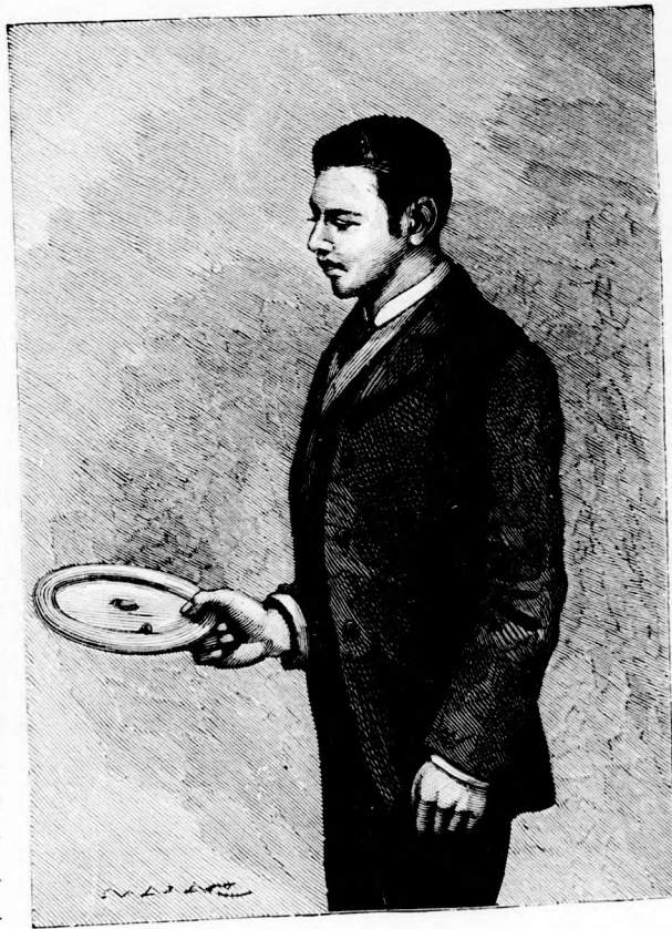
BÜVÉSZET. A megfoghatatlan golyó.

— Szükséges lesz egy-némely holmira, ha elmegyek. Most mindjárt össze rakom egy csomagba és ma délután magammal viszem az erdőcskébe. Tudok ott egy nagy odvas fát, abba elrejttem... nem bántja ott senki, mert ez az ostoba babonás nép nem mer a boszorkányos erdőben járni. Pénteken hajnalban aztán kényelmesen elillanhatok innen, elő