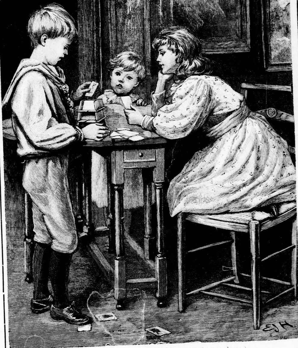
... ÉPITETTE A KÁRTYA-VÁRAT. (Lásd a 157. lapon.)

XLVIII. köt. 10. szám. Ára negyedévre 1 ft. Egyes szám ára 12 kr. 1895. márczius 10-én. Megjelen minden vasárnap 16 oldalon.