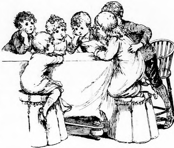
. . . A TÖBBIEK HALLGATTÁK.

Mariskák oda adták a könyvet s Ferike gyorsan eldugta a kabátja alá. Otthon a