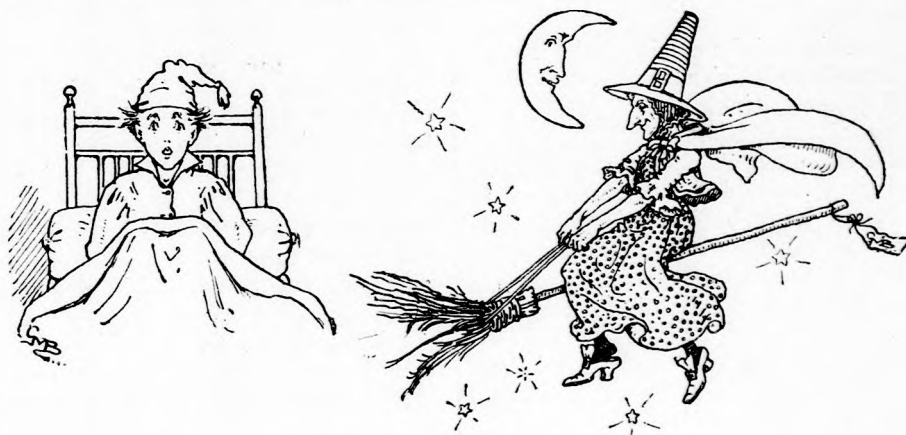
... BENYARGAL, SÖPRŰN ŪLVE.

Ijedtében akkorát sikoltott, hogy ... fölbredt álmából. De meghallotta a sikoltást a mama is és benyitott, hogy lássa, mi a baj. Ferike csak nehezen bírta megmagyarázni; de a mama megpillantotta az asztalon a mese-könyvet és mihamar kivallatta Ferikét.