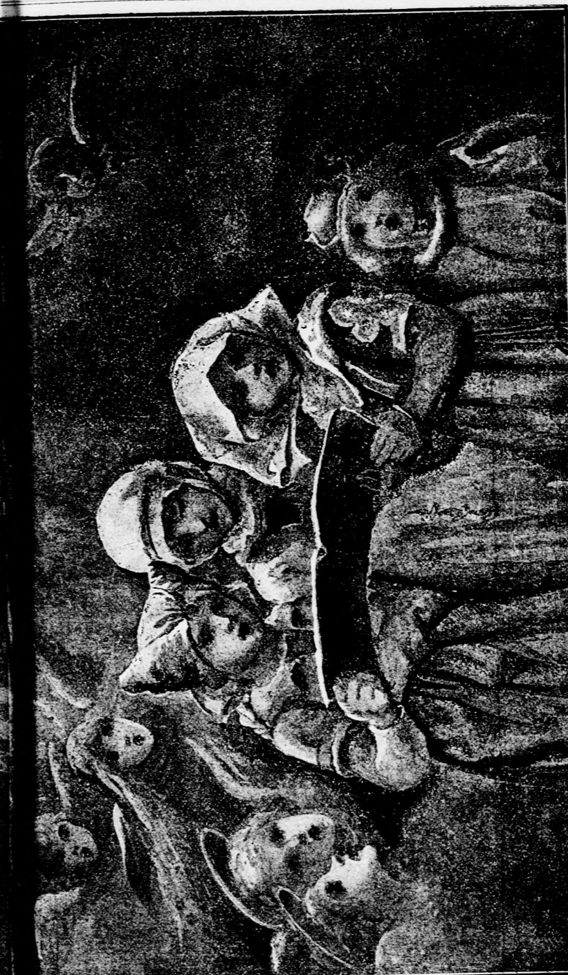
ÁHÍTAT. (Lásd a 70. lapon.)

Nyuzzika reszketve került vissza Tapsikához, aki így szólt: — Jaj de aggodtam miattad. Csak hogy itt vagy! Talán nem is hallottad ijedteden, mit kiáltott Bibi, mikor azt hitte, hogy veszte vagy. De én hallot-