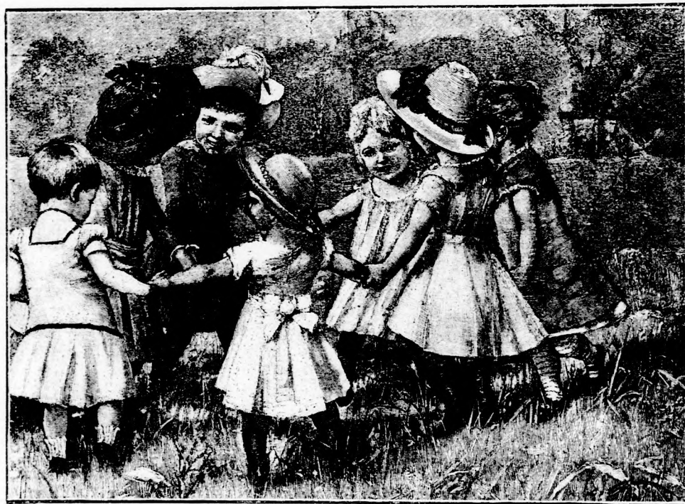
TÁNCZ A GYEPEN. (Lásd a 74. lapon.)

hogy nem osztották be más közönséges rabok közé, hanem egészen külön, egymagában kellett zárt udvaron fát vágnia, majd a várkertben ásnia, kapálnia. A kegyetlen börtönőr mindennapra más más nehéz munkát talált. Szerencsére a szegény rab napról-napra jobban győzte. Nyoma sem volt már rajta a régi kövérségnek,