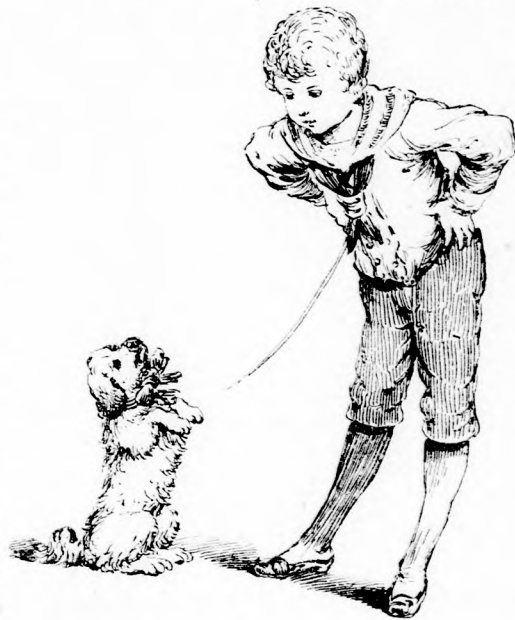
. . . TELJESITETTE PARANCSAIT. (Lásd a 133. lapon.)

— Most is álnok vagy, mint régen te. szólt Misi király. Persze, félsz, hogy gonosz tetteredért most lakolni fogsz. De ne félj, nem lesz bántódásod. Amit vesztetted tettel, az szerencsét hozott reám, én tehát megbocsátok.