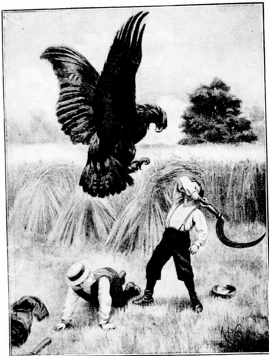
HARCZ A SAS-MADÁRRAL. (Lásd a 124. lapon.)