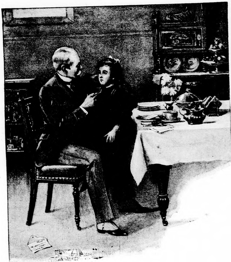
... A TÉRDÉRE ÜLTETTE. (Lásd a 211. lapon.)

No de a leczkének is vége lett egyszer valahára s ekkor a kisasszony mindjárt nagyon érdeklődve hallgatta a nagy ujsá-