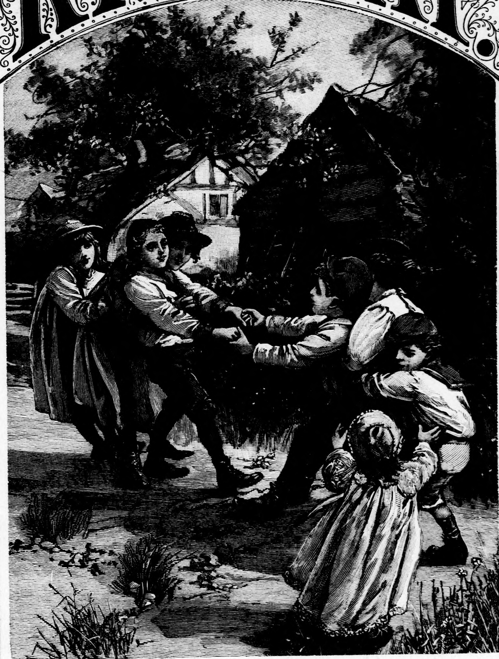
HUZALKODÁS. (Lásd a 227. lapon.)

en ki- en- et) nyo- ibla iból eum e 3. épület. XLIX. köt. 14. szám.