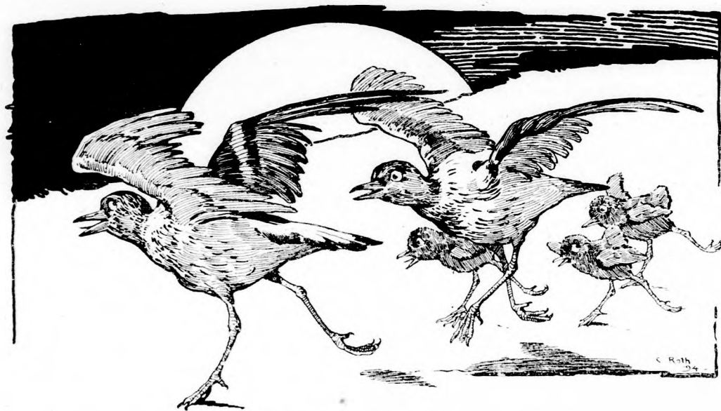
... RIADOZVA FUTOTT.

Lassan-lassan azonban fogyatkozni kezdett a bőség és csökkenni a kényelem. Egyre hidegebbre fordult az idő, eleséget már nem találtak közel, ki köllött menni a letarolt mezőre s ott is alig-alig akadt. És még ha csak ez volt volna a baj! De a mezőn vadászok jártak, vadász-ebek szaglálótak s mind-untalan halálos veszedelem kerülgette a víg családot, mely most már éppen nem volt víg, hanem ugyancsak riadozva futott s éhesen, dideregve lapult meg, ahol valami jó buvó-helyet talált.