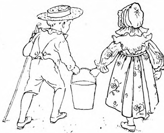
MEGINDULTAK A VÖDÖRREL.

— Ejnye, Gáborkám, hát mi ez? Csak ma reggel fogadtál minden jót és szépet