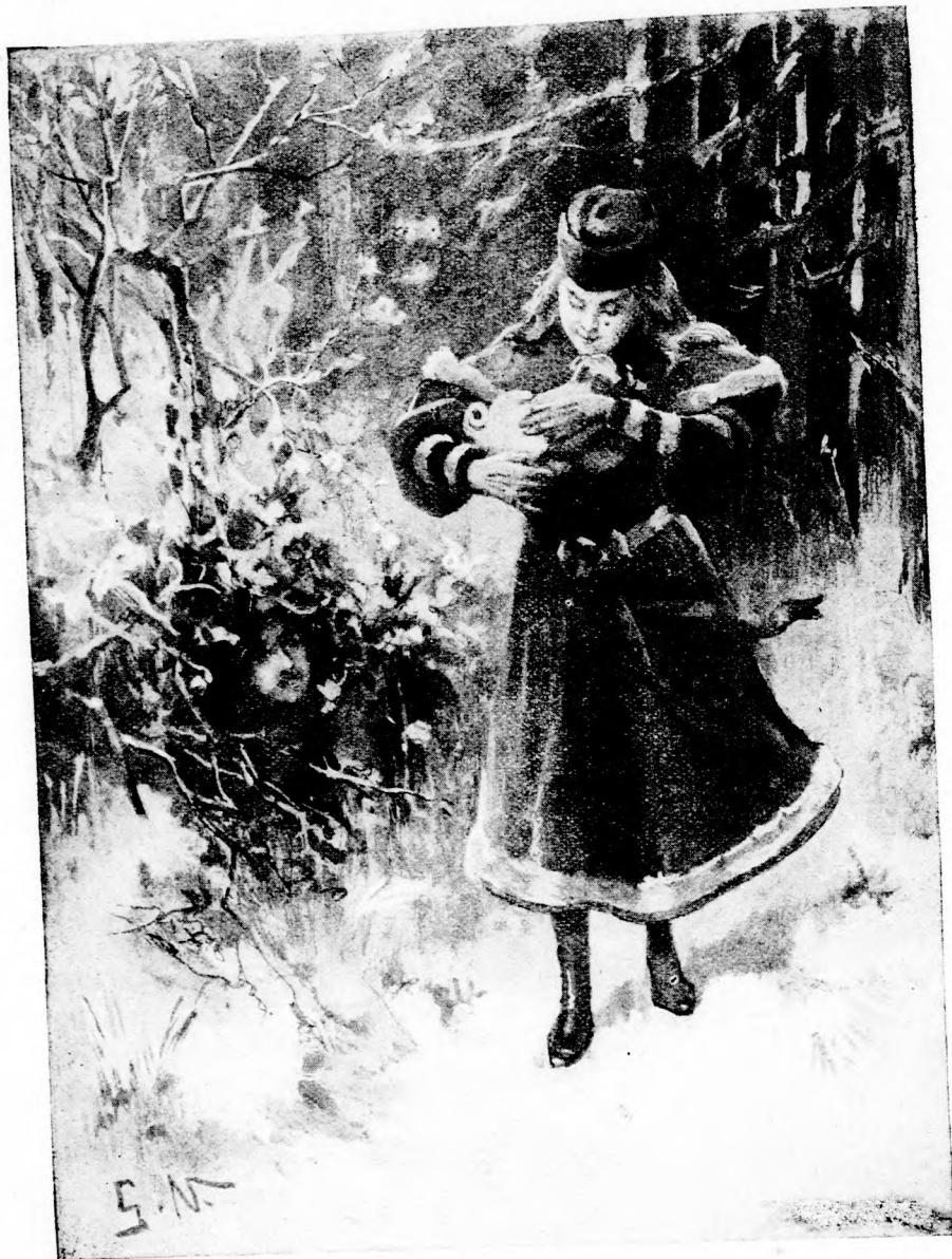
... ÖRÜLTEK EGYMÁSNAK. (Lásd a 233. lapon.)