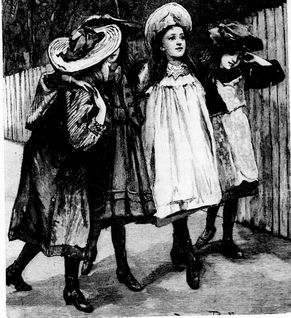
RÖVID NAPPÉNY. (Lásd a 235. lapon.)

XLIX. köt. 15. szám. Ára negyedévre 1 fit. Egyes szám ára 12 kr. 1895. október 13-án. Megjelen minden vasárnap 16 oldalon.