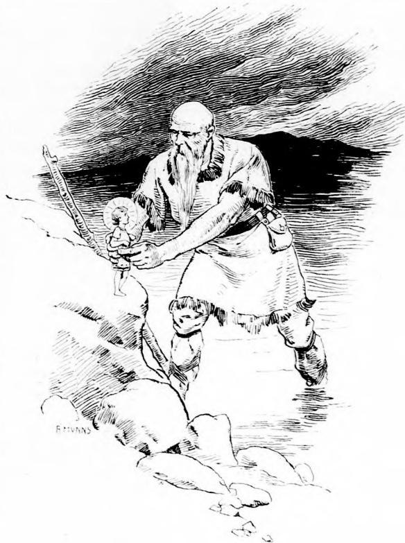
... LETETTE A GYERMEKET A PARTRA.

Nem is bánta meg. Csakugyan roppant hatalmas volt ennek a királynak s még folyton folyvást gyarapította. Győzelmes háborukat vívott, messzi országokat meghódított és így az óriás Offerusnak bőségesen nyílt alkalma, hogy rendkívüli erejét kipróbálja. Szerzett is nagy dicsőséget magának is, királyának is; mind a ketten meg voltak egymással elégedve.