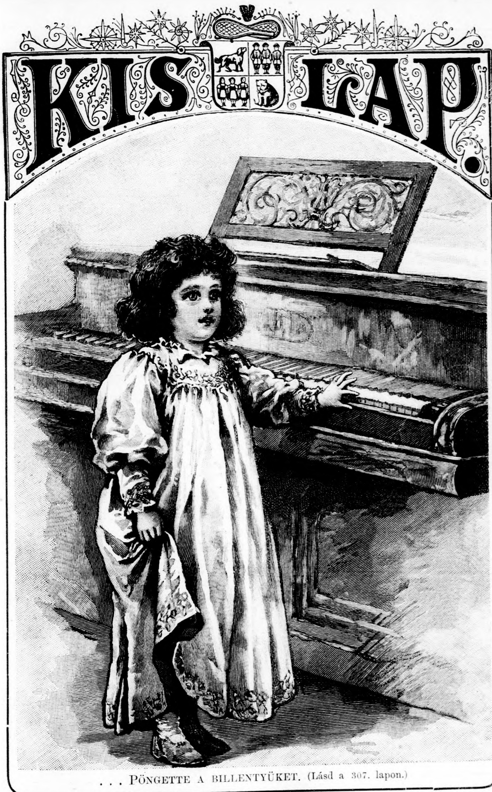
... PÖNGETTE A BILLENTYÜKET. (Lásd a 307. lapon.)

egyedül sa- ztatban. — valóban ülő Istent, ddig is az ágos leve- sodra. — esta sorait, ozzá: Kö- er Honka. en valami kalandot sty. Az a társaidnak kusza ír- — Moesz razán ked- apon oda szben va- 5 füzetke nek az ára a, tolóka, k vannak nem je- azt, hogy sem érde- r Ferike. ójós meg- em. hogy s használt yszer csak hullanak kis tündér a, de még retet illata Zoraida, értelme az osodott kis de mind van abban ik olvasni azokkal a mindenik- türelem az, inek azon- hibás. — te olvasó- Lap-ban? és kíván- yek egyéb m fotogra- a a lapban, amennyien uj jön és az arezké- ztess meg,