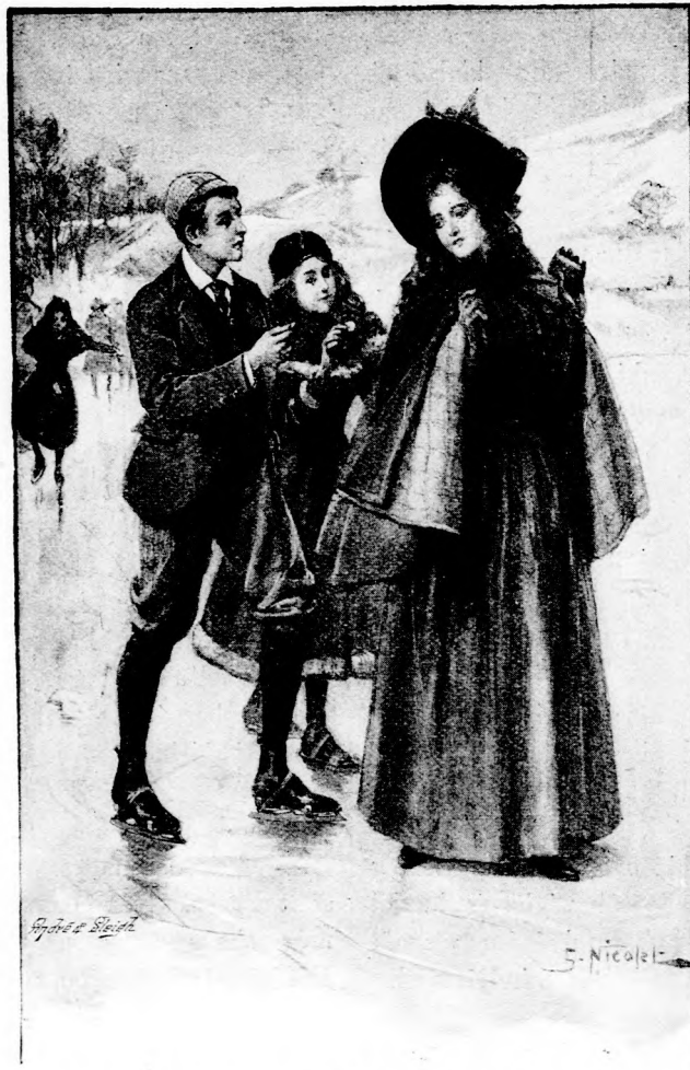
. . . ÁTADTÁK A JÓTÉKONY ADOMÁNYOKAT.

— Ne gondoldj vele, ne faggass, ugy sem mondom meg, felelt Irma mogorván. Ha nincs meg a pénzed, akkor már ugy is mind hiába. És amnyit mondok: soha senki előtt se