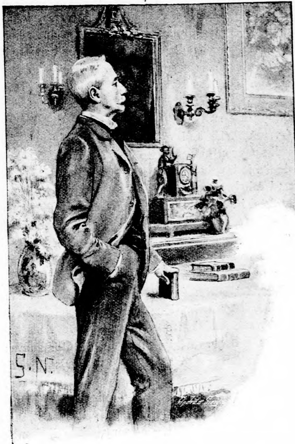
. . . SZIGORU TEKINTETTEL NÉZETT VÉGIG.

jóformán egy pillanatra se hagyja Saroltát magára. Csakugyan el is múlt az est, le is feküdtek és minden a régiben maradt. Reggel pedig Irma már ilyenforma gondolattal kelt föl: