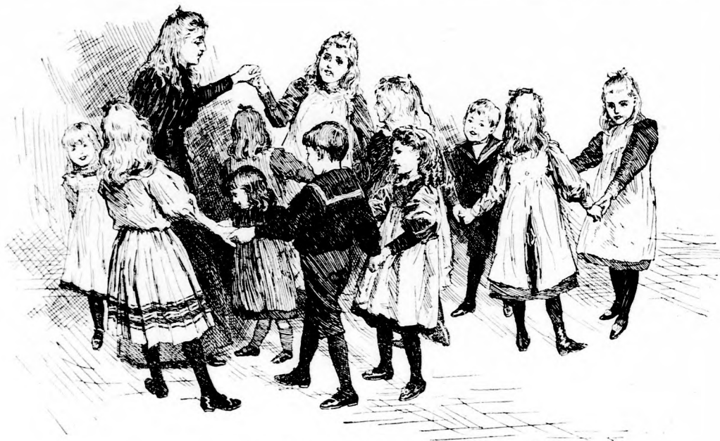
A KAPU. (Lásd a 318. lapon.)

Ez a mese, ezt köll eljátszani. Egyik játékos, még pedig olyan, akinek jól pereg a nyelve, lesz az anyóka; egy másik, aki aztán sivalkodik, rőfög, ugrándoz és rugdalózik, a malaczka, akit az anyóka pórázon vonszol maga után. Mivel a malaczka