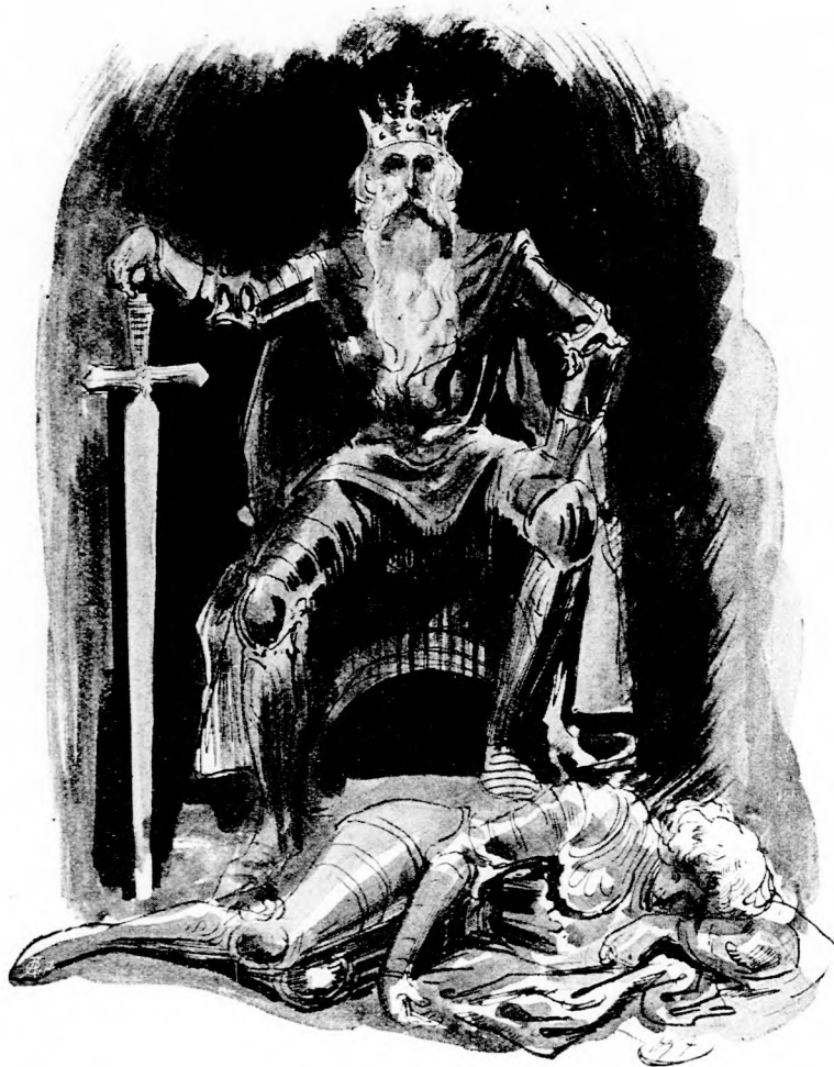
... A FÖLDÖN HŰ CSATLÓSA.

Hamar elértek a nagy barlang tulsó végére. Ott egy kisebb barlang nyílt s ebben trónuson ülve, kezében hatalmas kardjára támaszkodva ült nagy méltósággal a király, fején koronával. Látszott rajta,