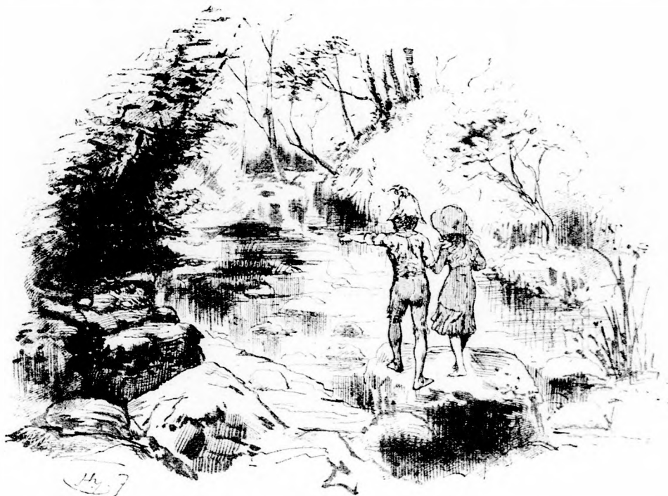
AMOTT TUL VAN AZ IGAZI LÁTNI VALÓ.

Mentek hát tovább. A patak egyre magasabb sziklák közé vezette őket, a víz zuhogva, tájtékozva tört meg a mederből kiemelkedő nagy köveken; de ezek meg nagyon jók voltak arra, hogy a két vándor egyikről a másikra ugrálva, jóformán száraz