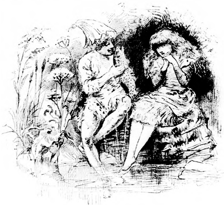
A HAL IJEDTEN TÁTOGATTA A SZÁJÁT.

A hal ijedten tátogatta a száját, de nem szólt