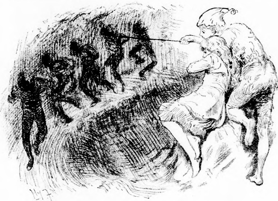
SIETVE JÖTT NEHÁNY SÖTÉT ALAK. (Lásd a 334. lapon.)

nincs kifogása, tőle bátran szedheti föl a kincset. A második, harmadik s a többi bányász is úgy tett; Évike tehát csöppet sem habozott, hanem szaporán szedogette föl az ökölnyi szinarany-darabokat, diónyi gyémántokat, rubintokat és más mindenféle drága-köveket. Már alig fért a kötényébe, de meg olyan nehéz is volt már, hogy alig bírta. Szinte örült, mikor a néma bányá-