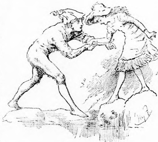
... MAJD SEGITEK.

— Sokkal szebb! Hanem, mondd csak, ki vagy te? Nekem van bátyám is, öcsém is, ösmerek más fiukat is, de azok mind egészen más formák.