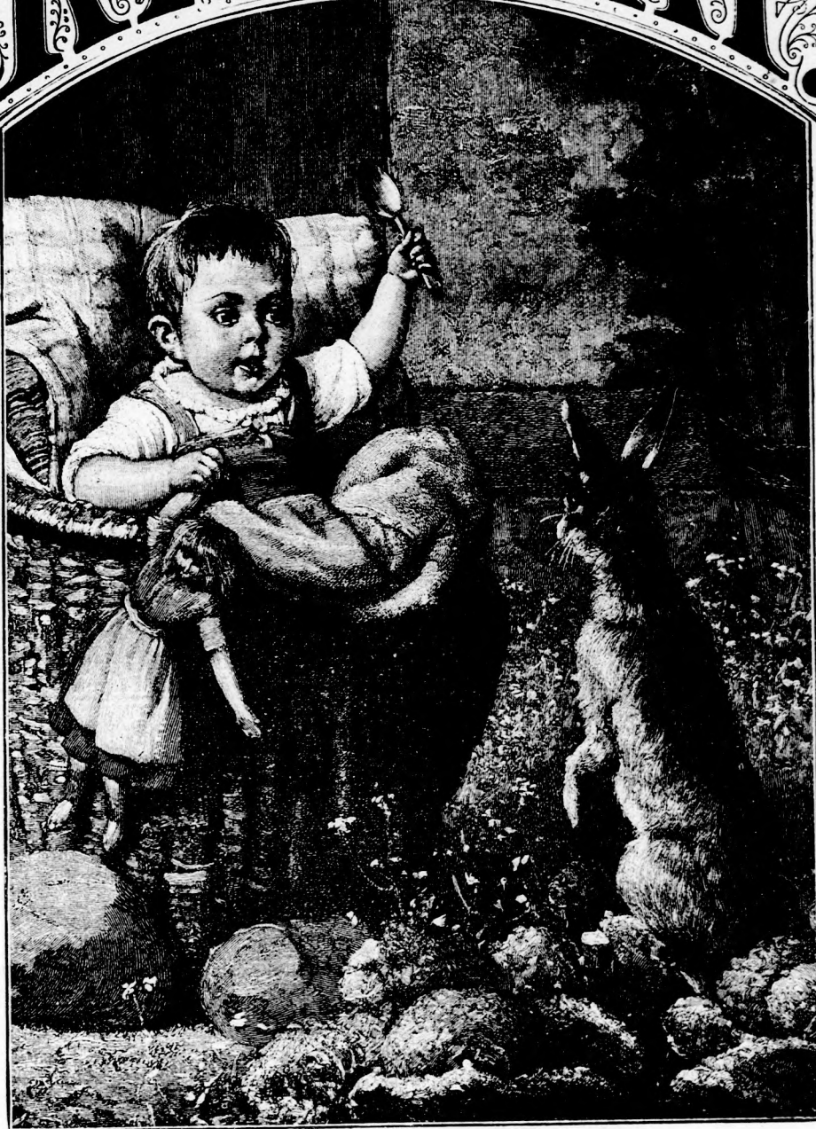
A RAVASZ NYUSZI. (Lásd a 339. lapon.)

XLIX. köt. 21. szám. Ára negyedévre 1 frt. Egyes szám ára 12 kr. 1895. november 24-én. Megjelen minden vasárnap 16 oldalon.