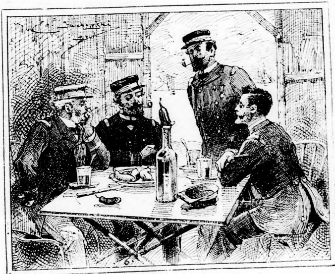
BÜVÉSZET. A bűvös palaczk.

De még érdekesebb, ha gyümölcsöt hámoztatunk a bűvös palaczkkal. Erre a célra egy délszaki gyümölcs alkalmas, melyet nálunk is sok fűszeres boltban kaphatni: a banána. A palaczkba égő papiros helyett egy kevéske borszeszt önthetünk s beledobott égő gyújtószállal meggyújtjuk. Ezután a banánát, melynek teljesen érettnék, lágnak kell lennie, egyik végén három vágással behasítjuk és félre görbitvén a héj