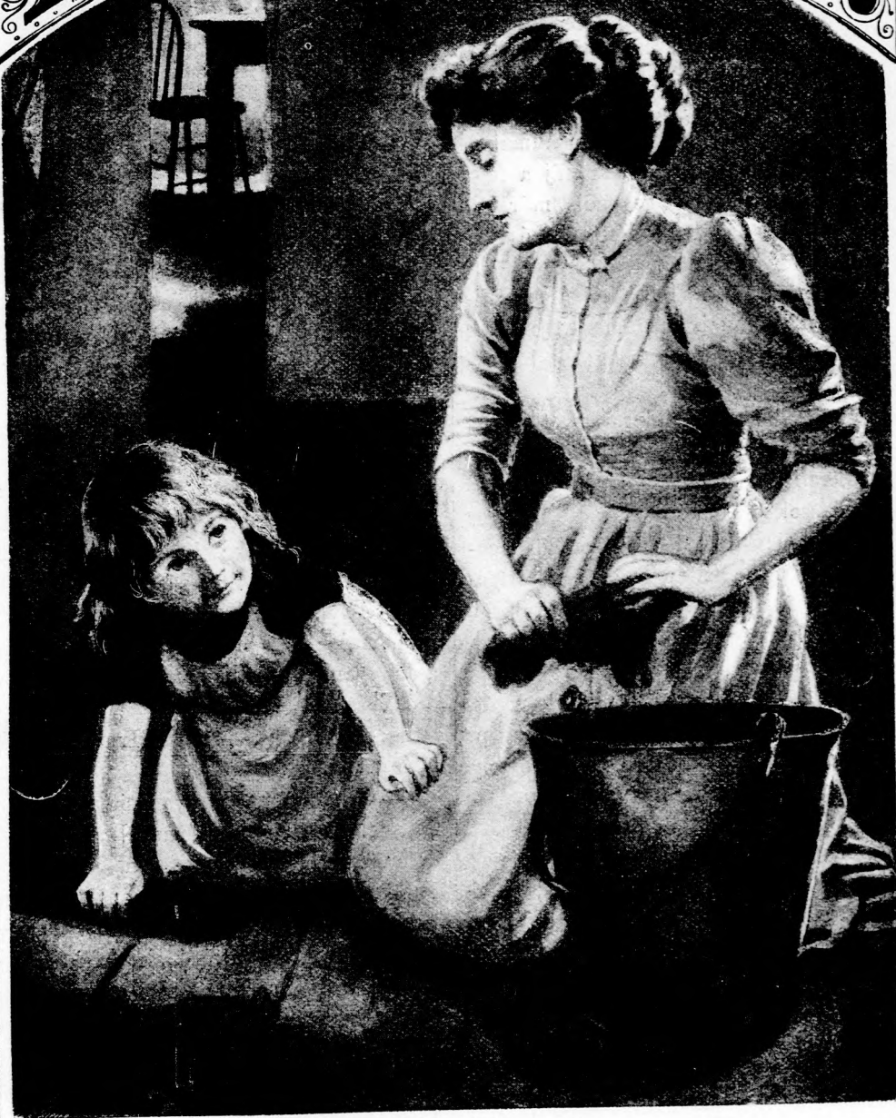
PALLÓ-SURLÁS. (Lásd a 354. lapon.)

XLIX. köt. 22. szám. Ára negyedévre 1 frt. Egyes szám ára 12 kr. 1895. december 1-én Megjelen minden vasárnap 16 oldalon.