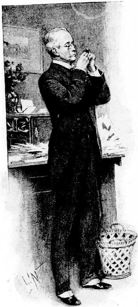
... FIGYELMESEBBEN MEGNÉZTE.

tam. Talán egyéb jutalommal kárpótolom. Majd meglátom. Ezt a forintost nem adom. Ezt oly kemény hangon mondta, hogy