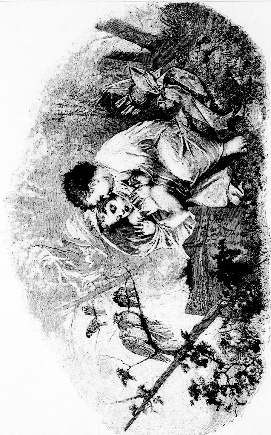
. . . KEZÜK-LÁBUK MELENGETTÉK. (Lásd a 62. lapon.)