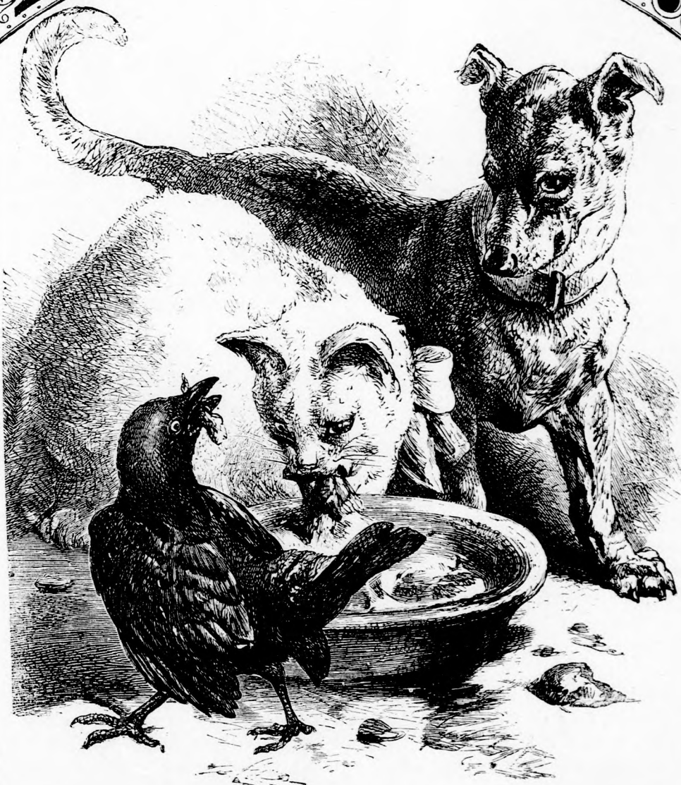
... KÖZÖS TÁLBÓL FALATOZTAK. (Lásd az 54. lapon.)