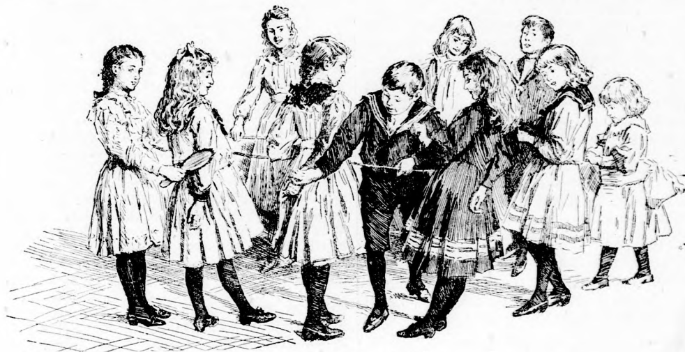
HOL A KEFE?

Nem szabad vaktában akár milyen betűvel toldani meg a megkezdett szót, hanem csak olyannal, amely igazán teljes értelmű szó felé vezet; vita esetén mindenki köteles megmondani, milyen szóra gondolt és ha a megkezdett szóhoz olyan bötüt toldott, amely után nem lehet többé értelmes szót alkotni belőle, akkor zálogot fizet. Hanem persze, mindenki más más szóra