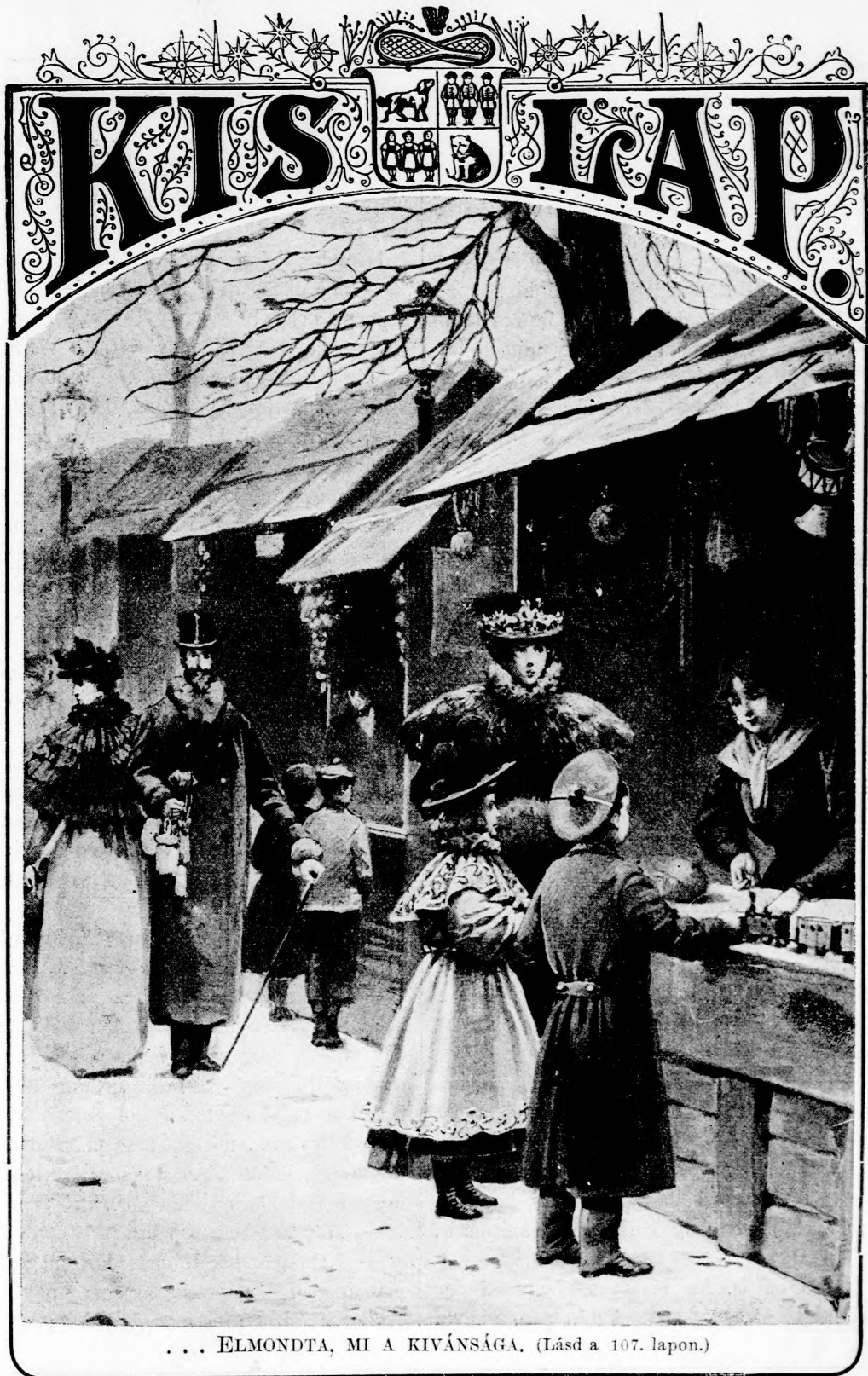
... ELMONDTA, MI A KIVÁNSÁGA. (Lásd a 107. lapon.)