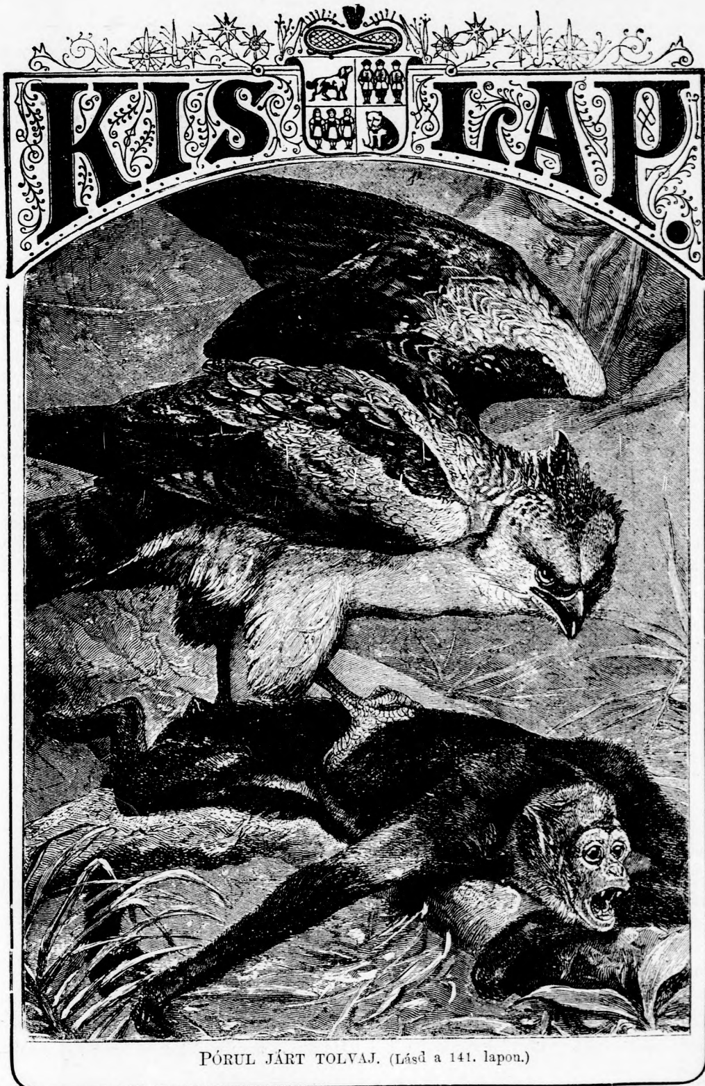
PÓRUL JÁRT TOLVAJ. (Lásd a 141. lapon.)