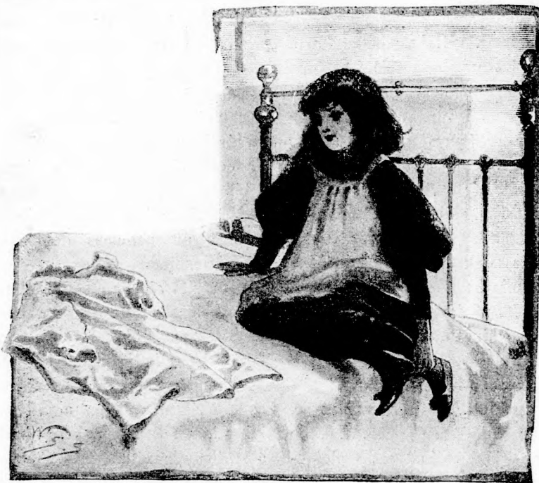
... NÉZTE AZ ÚJ RUHÁT. (Lásd a 133. lapon.)

szobát is épp úgy, mint a többi, nagy elkeseredésére a testvérpárnak. Ugy ragyogott, csillogott most már minden a házban, hogy Ákos és Lenke szinte idegenül érezték ott magukat; sehol sem lehet csak egy piczikét is rendetlenkedni, hogy rögtön szemet ne szurjon. És még csak a sa-