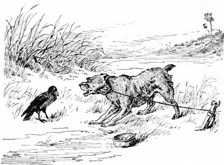
A FURFANGOS HOLLÓ.

Egy napon a gazda kivezette kutyáját a majorság szomszédságában levő földre. Valami értékes veteménye volt ott s úgy gondolta, hogy az éber eb az ő mérges