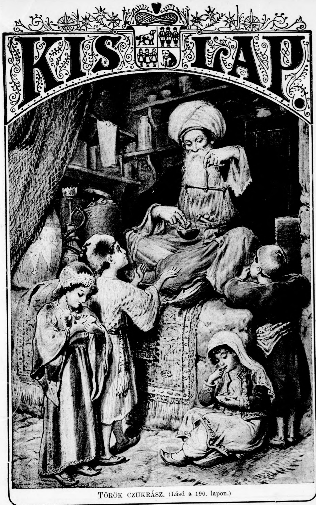
TÖRÖK CZUKRÁSZ. (Lásd a 190. lapon.)

LI. köt. 12. szám. Ára negyed évre 1 frt. Egyes szám ára 12 kr. 1896. szeptember 20-án. Megjelen minden vasárnap 16 oldalon.