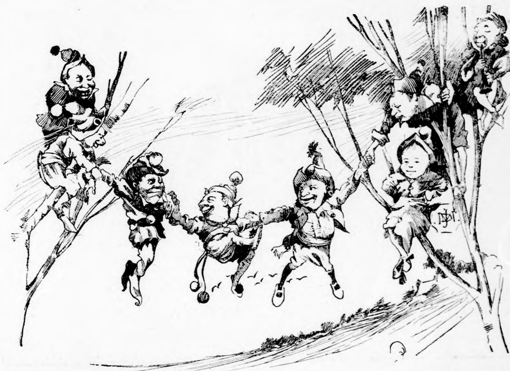
... HIMBÁLÓZTAK A LEVEGŐBEN. (Lásd a 204. lapon.)

— Láthatod! Én kapitány vagyok a tündér- királynő ő felsége seregében és most