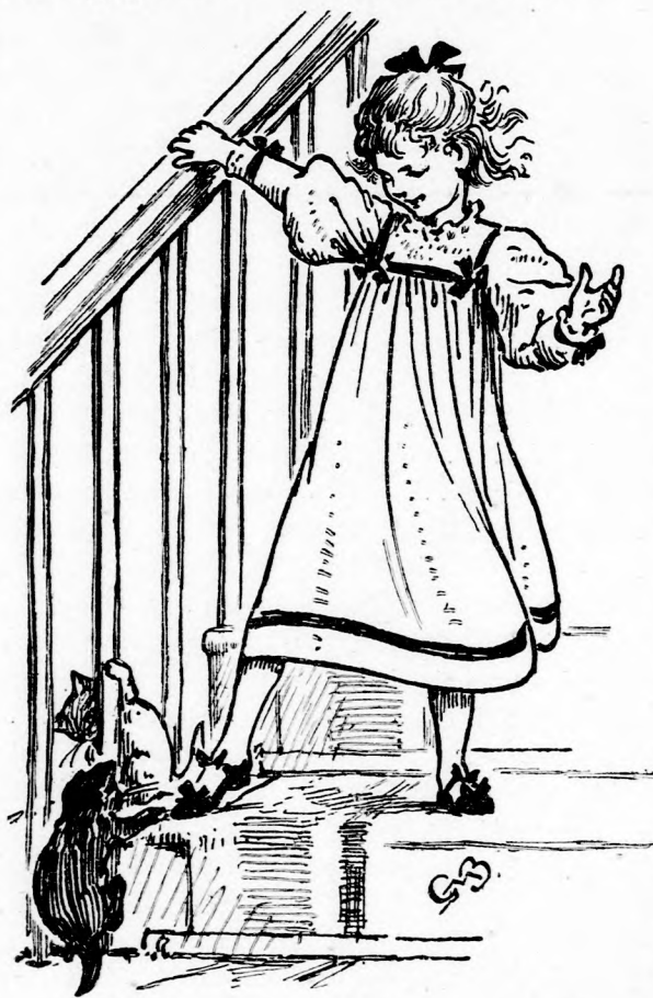
JÁTSZÓ CZICZÁK. (Lásd a 198. lapon.)

Ficzko nem igen értette, milyen veszedelemről van szó; inkább vig kaffogással felelt. Palika a zsebében kotorászott s szerencsésen talált is benne hosszú zsinetet. — Megállj no! Ha már itt vagy, legalább mellettem maradsz.