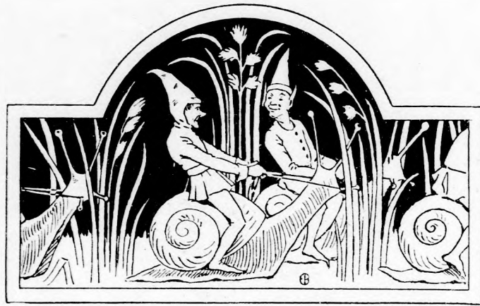
... BIZTOSAN ÜLTÉK MEG A CSIGA-PARIPÁT. (Lásd a 207. lapon.)

Nem sokára eljutottak oda, ahol Bénike eleinte ült s ahonnan persze látni lehetett azt a helyet is, ahol fölkapaszkodott. Még pedig