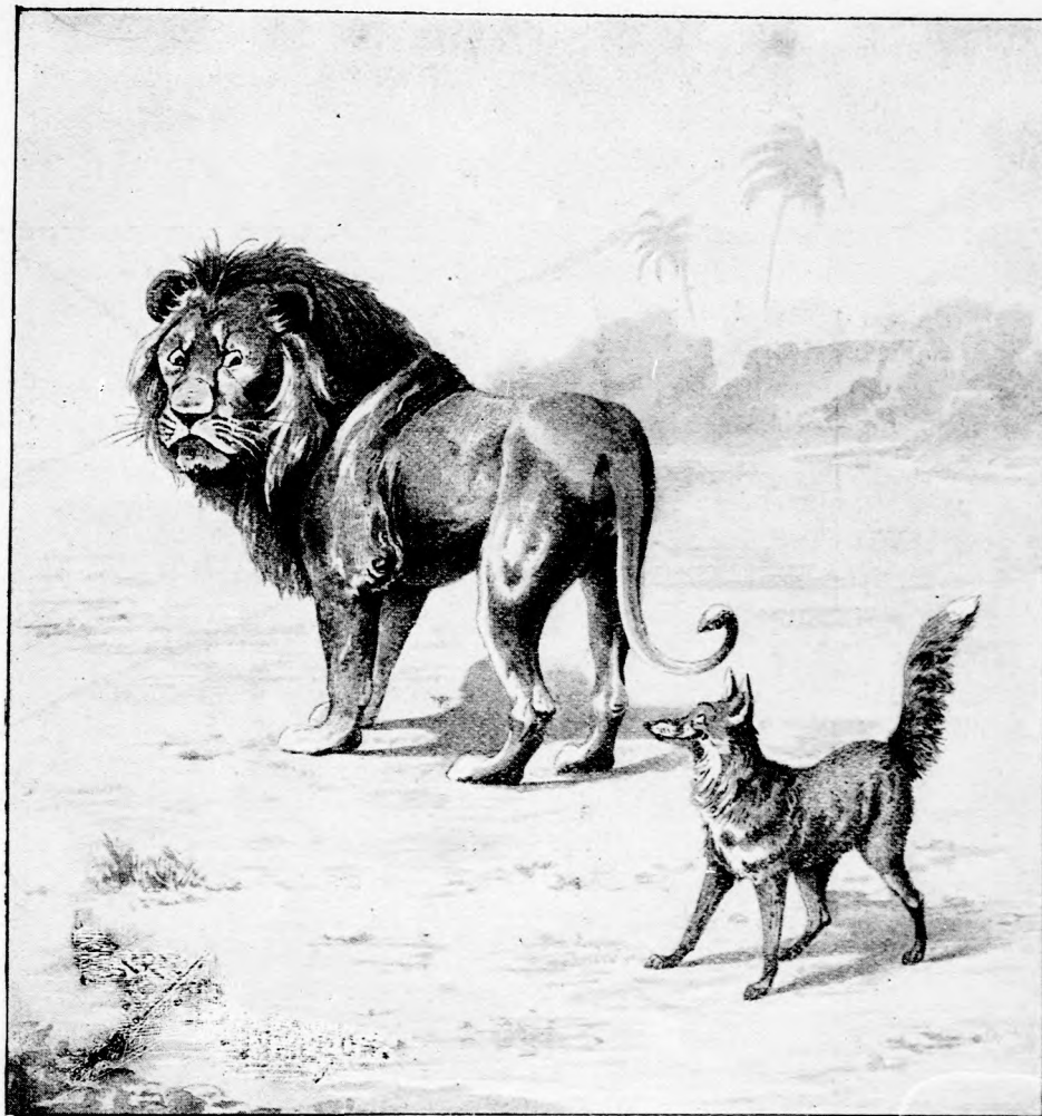
— NŐ ÖREG, HOGY VAGY? (Lásd a 203. lapon.)

sel áll szóba. Messziről is látszik hogy csak kurtán osztogatja parancsait. Egyik tiszttel azonban mégis hosszabban beszélgetett és Palika nagy örömmel ismert rá,