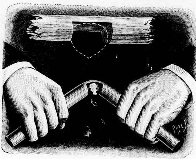
BÜVÉSZET. Rögtönzött mogyoró-törő. (Lásd a 222. lapon.)

És egyszerre csak ismét hallatszott az a zugás, sístergés, ropogás és a következő