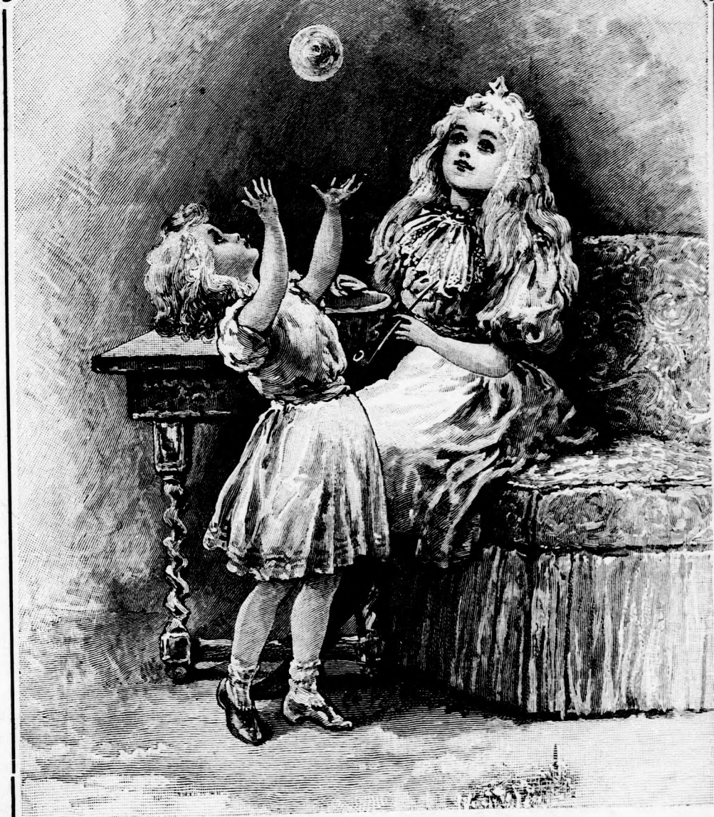
SZAPPANY-BUBORÉK. (Lásd a 213. lapon.)