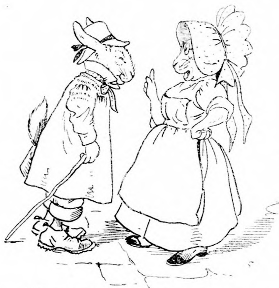
... JÓL VIGYÁZZ A PÉNZRE! (Lásd a 343. lapon.)

— Azt tanácslom, kedves Tapsifüles gazda, hogy majd csak otthon vegyen be