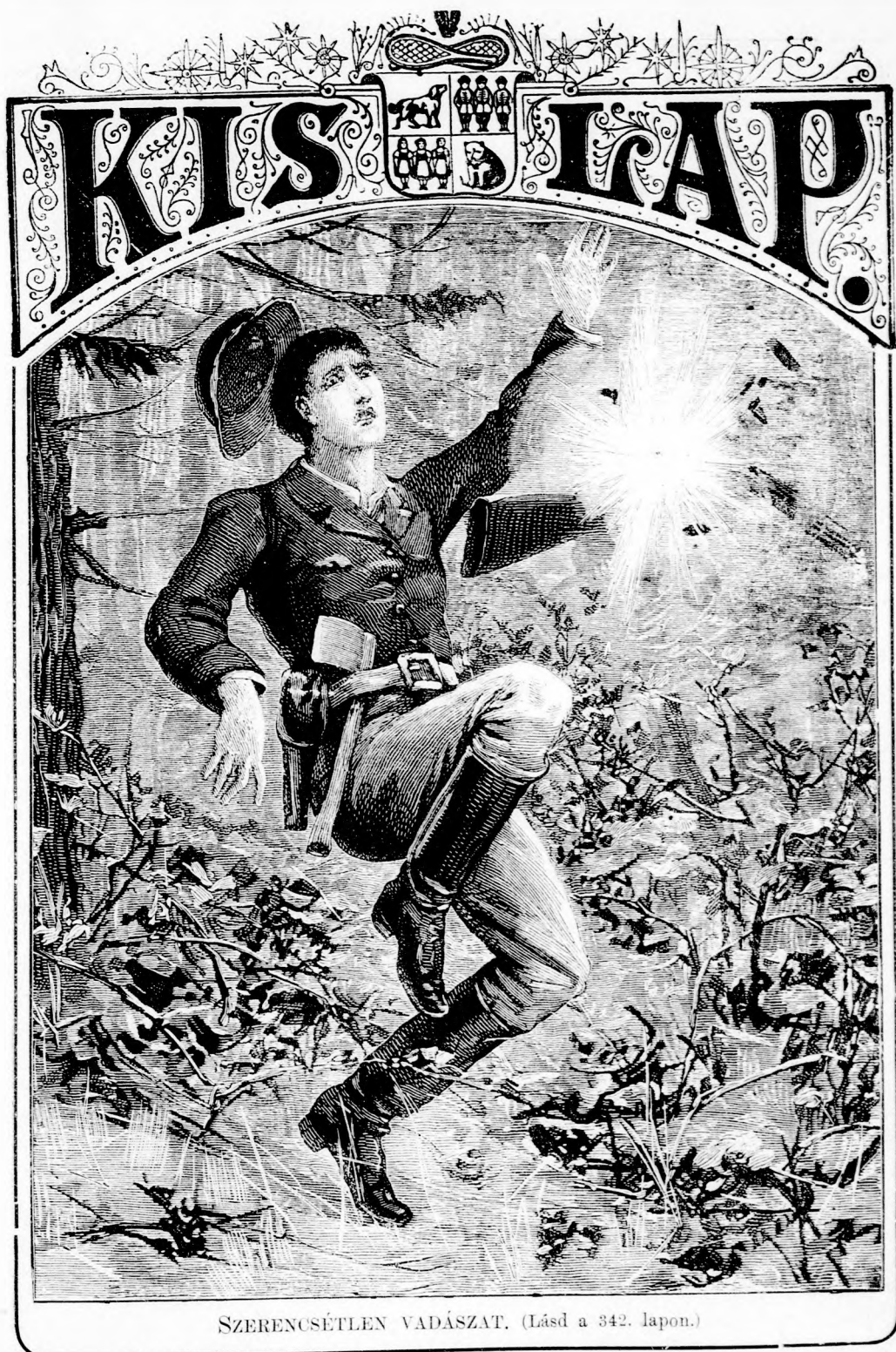
SZERENCSETLEN VADÁSZAT. (Lásd a 342. lapon.)

LI. köt. 22. szám. Ára negyed évre 1 frt. Egyes szám ára 12 kr. 1896. november 29-én. Megjelen minden vasárnap 16 oldalon.