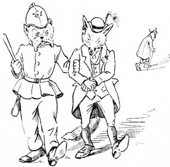
... BEKISÉRTE A HÜVÖSRE.

— Elbeszélem hiven, mi történt velem. Tanuljanak, okuljanak belőle a gyerekek. Érjék be azzal, amit a böles természet számukra kirendelt és ne higgyék el, hogy van varázs szer, mely megváltoztathatná azt, amit a Teremtő alkotott.