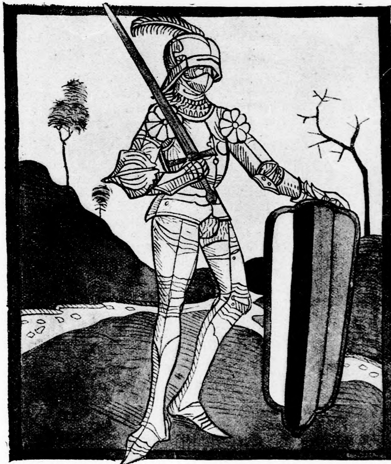
HUNYADI JÁNOS VÉRTES ALAKJA. Régi rajz nyomán.

Hozzá is látott Hunyadi azonnal, hogy a kis királyt kiszabadítsa. Haddal tört rá Fridrik császárra és oly keményen szorou-