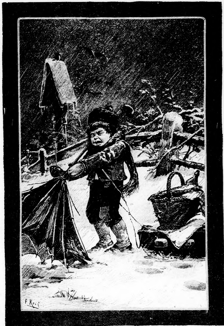
A KIFORDITOTT ERNYŐ. (Lásd a 23. lapon.)