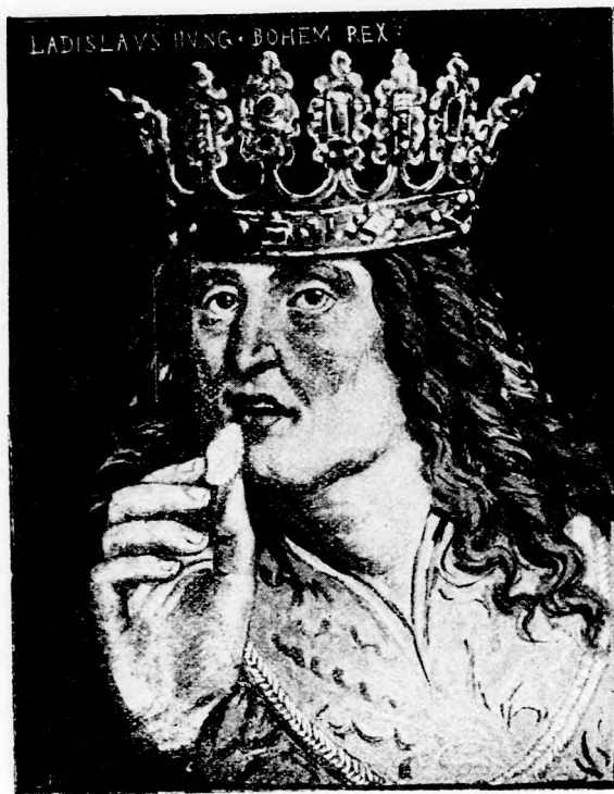
V. LÁSZLÓ KIRÁLY.

sze semmit sem tudott róla, hogy milyen viták folynak róla. Még ha megmondták volna is neki, bizonyosan meg nem érti, hogy már volna országa is a koronához; de most meg a gyámapja nem ereszti az országába. És ha megérti is, gyöngye gyermek létére mit tehetett volna erőszakos gyámja ellen? Nem ért biz' ő neki a király-volta akkor semmit.