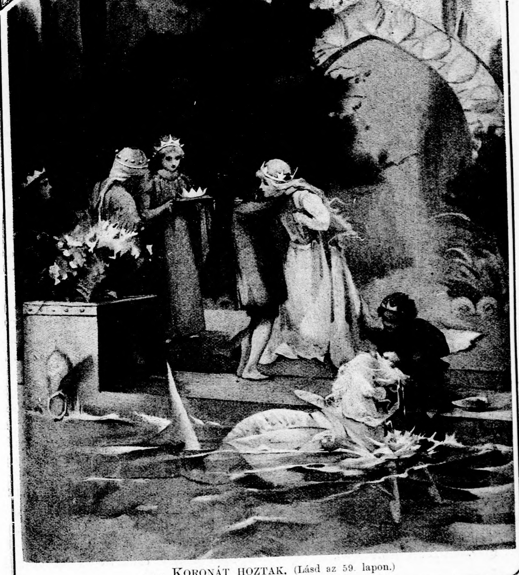
... KORONÁT HOZTAK. (Lásd az 59. lapon.)

LII. köt. 4. szám. Ára negyed évre 1 frt. Egyes szám ára 12 kr. 1897. január 24-én. Megjelen minden vasárnap 16 oldalon.