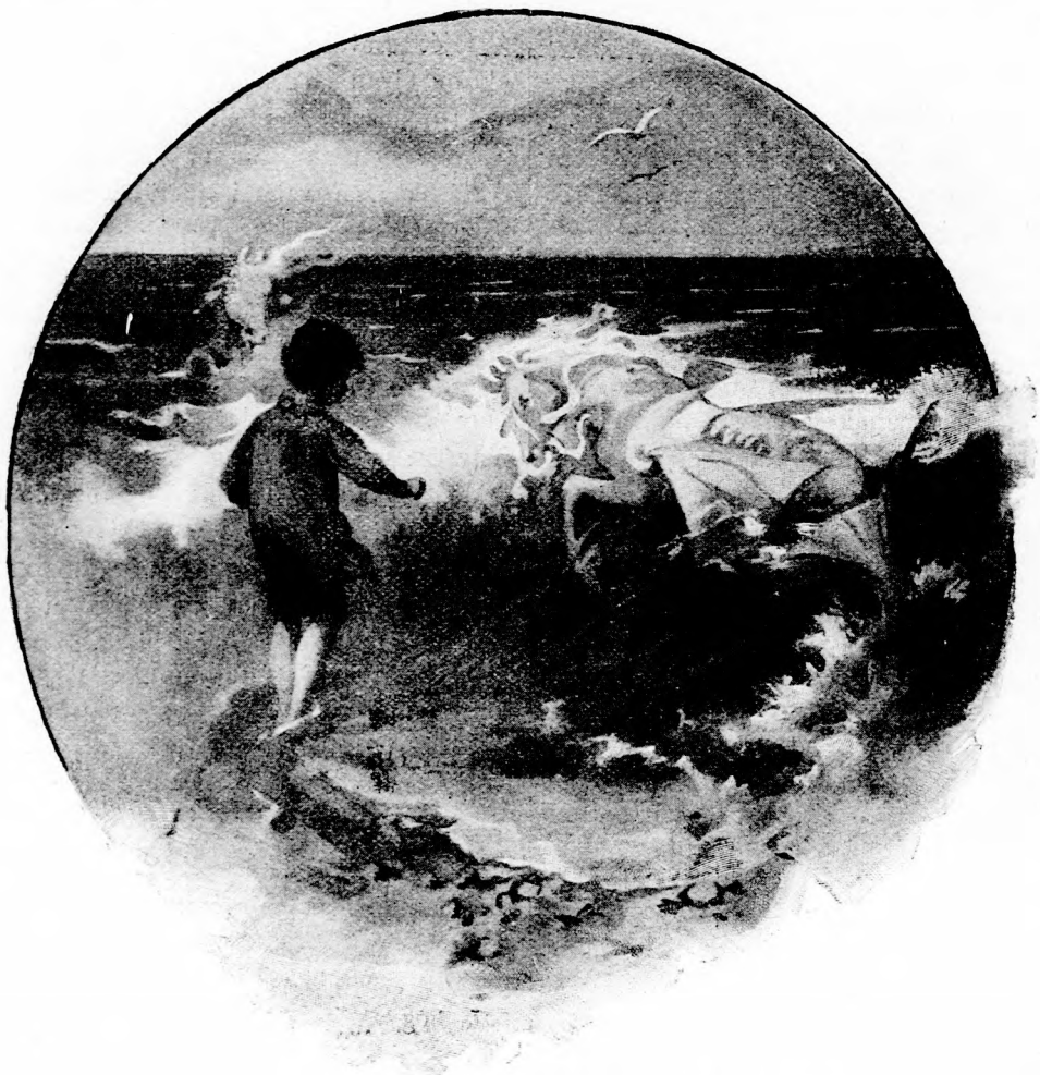
. . . NEKI INDULT A VIZNEK. (Lásd az 58. lapon.)

A negyedik napon együtt indultak ki s a folyó mentén játszogattak. A kis leány virágot szedett, Imrike a víz partján rákra lesett, míg végre bele unt.