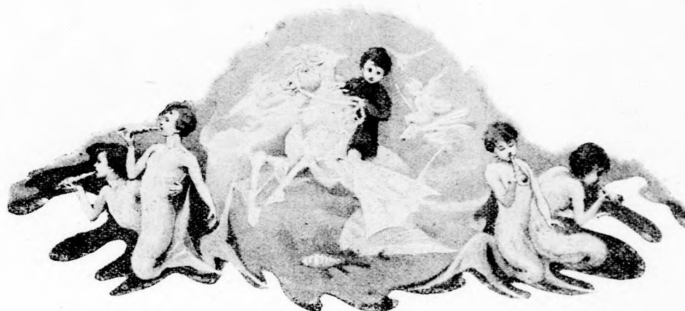
... LEBEGETT IS, USZOTT IS. (Lásd az 59. lapon.)

Végre haza ért, de itt kellemetlen meglepetés várta.