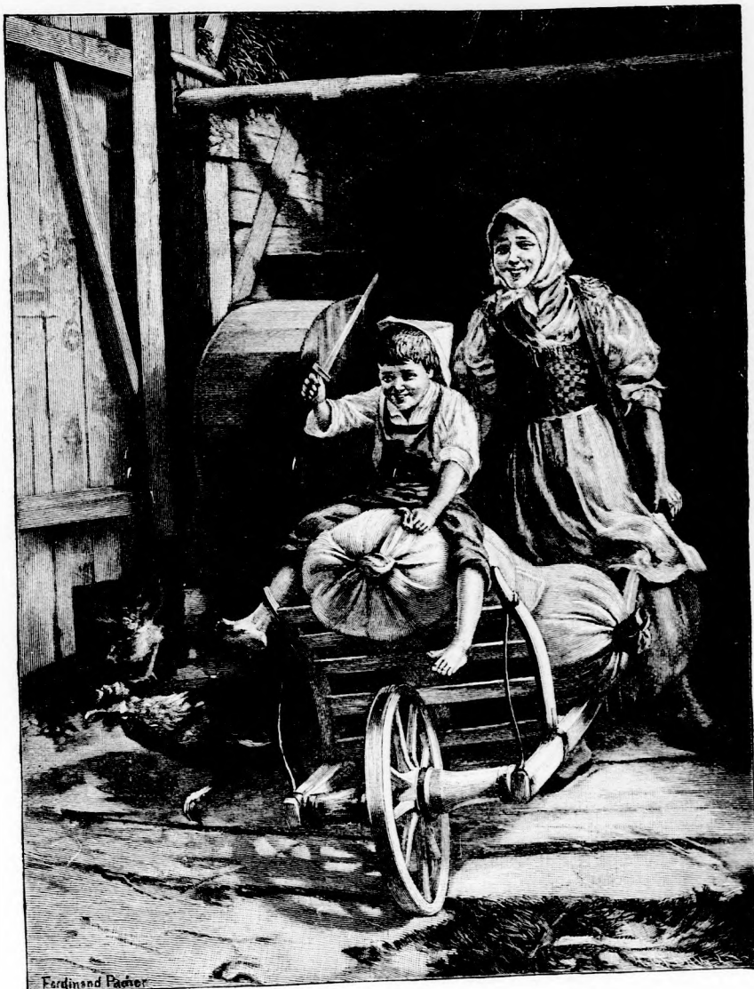
FURCSA PARIPA. (Lásd az 54. lapon.)

denben segített Kuruczné asszonynak, még pedig nagyon ügyesen; meglátszott