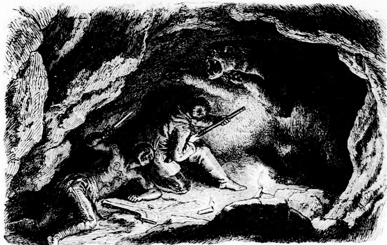
KÜZDELEM A SZÜRKE MEDVÉVEL. (Lásd a 275. lapon.)

— Mondja tovább, John bátyám! kérte rövid hallgatás után, szintén meghatottan az öreg elérzékenyülésétől.