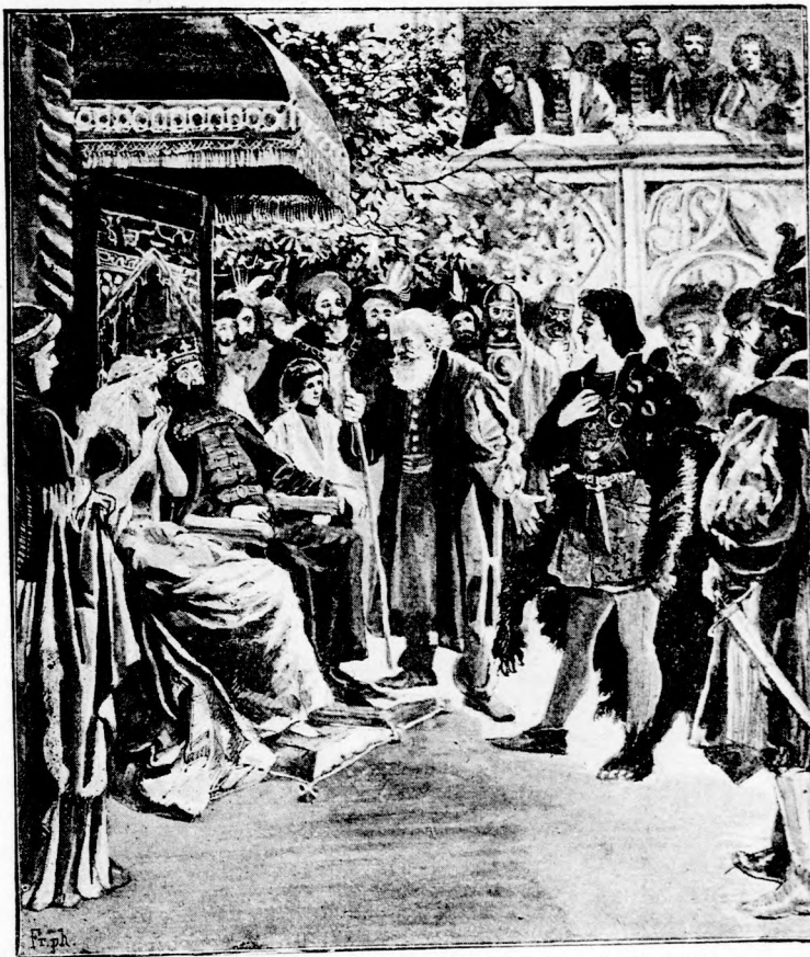
... DELI IFJU LÉPETT KI. (Lásd a 283. lapon.)